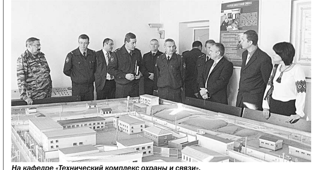
На кафедре «Технический комплекс охраны и связи».

системы электронного мониторинга подконтрольных лиц». Помимо основных тем доклада состоялась и презентация новейших технических разработок в сфере деятельности уголовно-исполнительной системы. Гости осмотрели учебно-лабораторную базу института, музей. Украинские коллеги остались довольны увиденным.