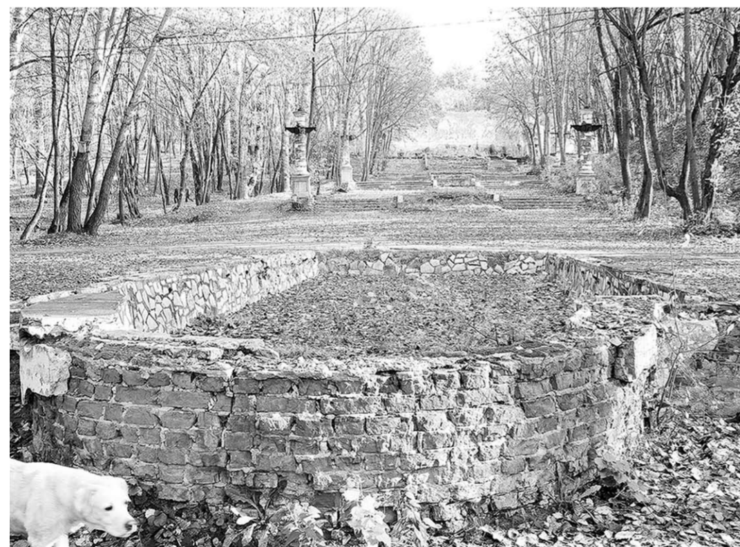
В таком плачевном состоянии парк «Динамо» сейчас.

Основные работы по реконструкции начнут выполняться уже в следующем году. Это было подтверждено восьмого ноября в правительстве области, где губернатор Алексей Гордеев провёл встречу с депутатами и представителями исполнительной власти областного центра, в ходе которой обсуждались перспективы развития столицы Черноземья в 2012 году. «Город будем улучшать. Это во всех отношениях выгодно и почётно... Продолжим работать», – заявил губернатор.