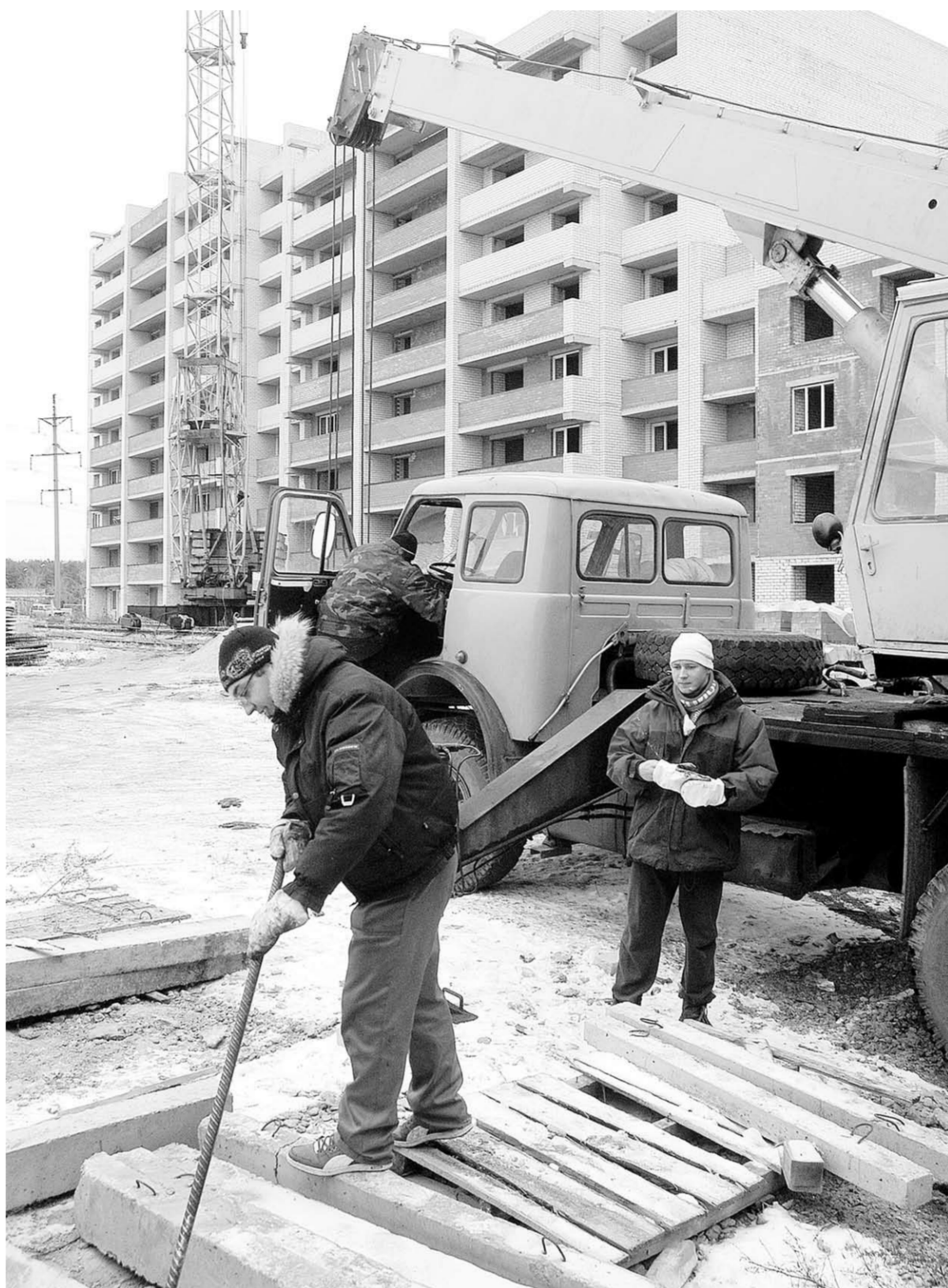
Понедельник. Жилищный комплекс «Золотое кольцо». После многолетнего затишья здесь появились строители.

«Если губернатор обещал, то всё будет сделано».