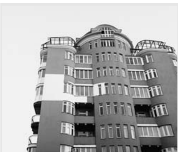
Стена без покрытия - температура на улице -6 градусов по Цельсию, температура стены со стороны улицы +3,5 градуса, температура стены внутри +9 градусов, температура воздуха в квартире +13 градусов, температура теплоносителя +38 градуса. Стена, обработанная «ИзоТермом», - температура на улице -6 градусов, температура стены со стороны улицы +2 градуса, температура стены внутри квартиры +16 градусов, воздух в квартире +17 градусов, температура теплоносителя +38 градусов.

ООО «Энергобаланс» г. Воронеж, Московский пр-т, 102 в, офис 205 Тел.: (473) 238-07-00 www.energovrn.ru