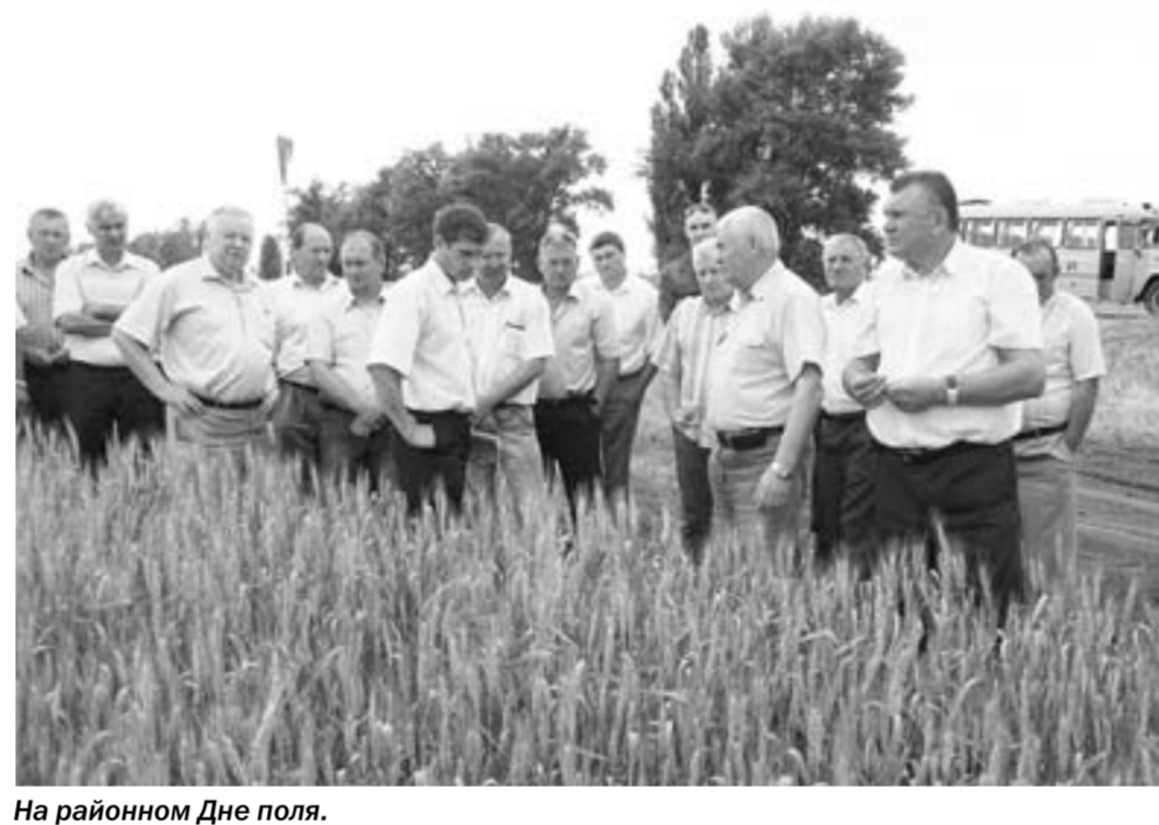
На районном Дне поля.