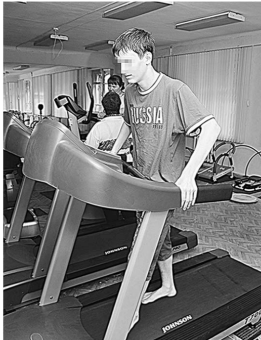
Идут занятия в тренажёрном зале.

ребенка, хотят найти ему замену в лице приемного. Как правило, им трудно смириться с тем, что этот малыш – совсем другой человек, что он не обязан быть клоном их прежнего сына или дочери. Или вот еще распространённый случай – попытка при помощи приемного ребенка сохранить распадающуюся семью. Некоторые ожидают от сиротки благодарности за заботу, за обеспеченную жизнь, за будущее наследство. Но детские глазки не горят, в них нет радости, любви к новым родителям.