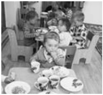
В поселковом детсаду.

А в нынешнем году гостеприимно распахнул свои двери поселковый детский сад, рассчитанный на сорок мест.