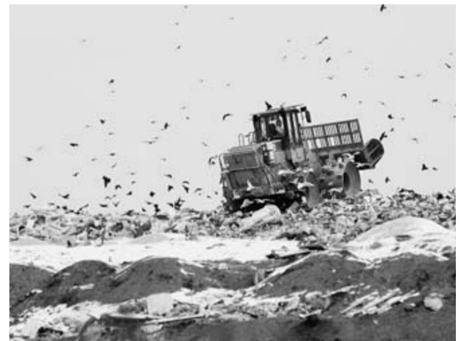
А это - полигон в Новоусманском районе.