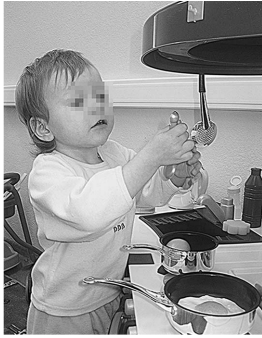
В лекотеке детей даже учат готовить. Правда, на игрушечной плите.

«В первую очередь, с мотивацией. Большинство потенциальных родителей принимают решение об опеке или усыновлении на уровне эмоционального порыва, а это очень ненадёжный фундамент для будущей семьи. Преодолевать трудности такие родители не готовы, они ждут, что всё пойдёт как по маслу, но так ведь не бывает. Другая не вполне надёжная мотивация – это когда люди, потеряв родного