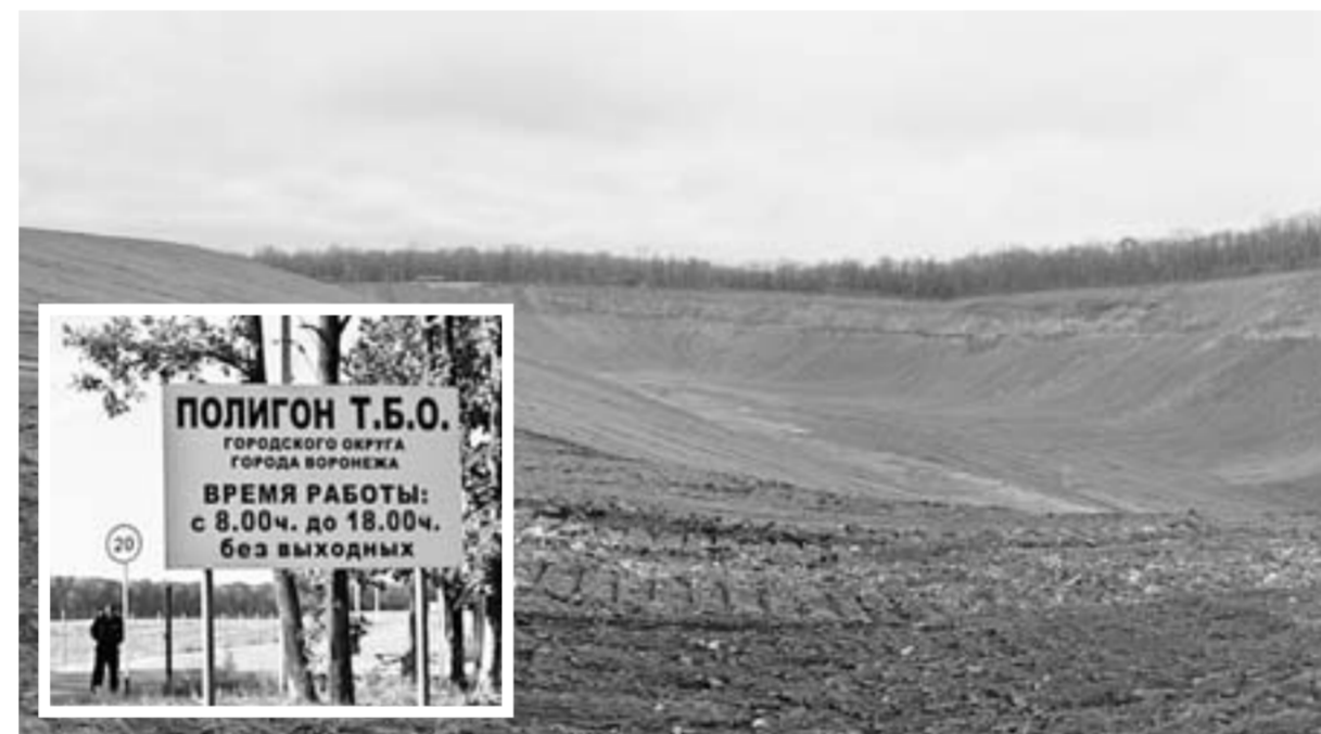
Так выглядит только что открытый полигон в Семилукском районе.