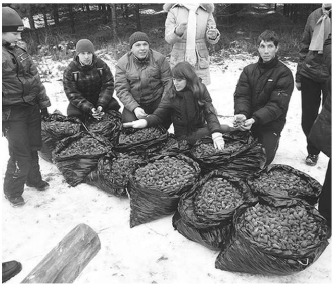
Скоро эти шишки станут соснами.

В девять часов от главного корпуса университета девятно пять человек поехали в Хреновской бор, разделившись предварительно на 11 команд по 7-10 человек. В лес прибыли не с корзинками, а с мешками и деревянными палками с битыми гвоздями – чтобы наклонять деревья и срыть шишки. Сбор проходил в форме соревнования: каждой команде нужно было набрать как можно больше шишек. Для наиболее активных и весёлых участников организаторы подготовили подарки: пазлы, елочные украшения, настольные игры. Планировалось собрать около тысячи килограммов шишек, которые в будущем могут превратиться в 200 000 молодых сосен. Студенты добыли 784 килограмма, отвели собранное к главному корпусу и уже оттуда чуть позднее своими силами отправляли в Сомовское лесничество.