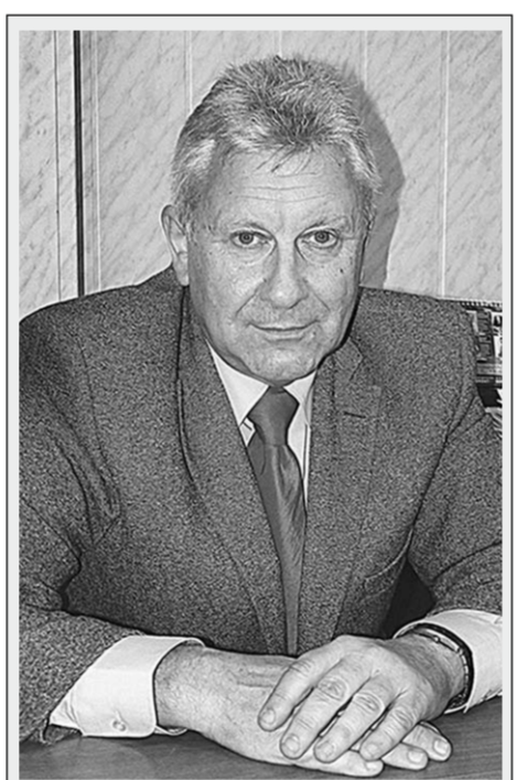
ИГОРЬ ЕФИМОВИЧ РИСИН,

Заданные в проекте Стратегии темпы инновационного наполнения экономики очень напряженные. Укажу только некоторые из них: удельный вес инновационной продукции должен вырасти с нынешних 12,8 процента до 40 процентов в 2020 г., уровень инновационной активности организаций – с 12,2 процента до 50 процентов. Именно инновации способны обеспечить опережающее экономическое развитие Воронежской области, достижение запрокинутого роста валового регионального