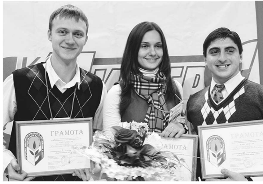
Победители «Студенческого лидера - 2011».

Заворающим испытанием стал конкурс «Сюрприз». Кажлему из конкурсантов по очереди зачитывалась видеоря и закончивший свое выступление монологом, который не оставил равнодушным ни жюри, ни