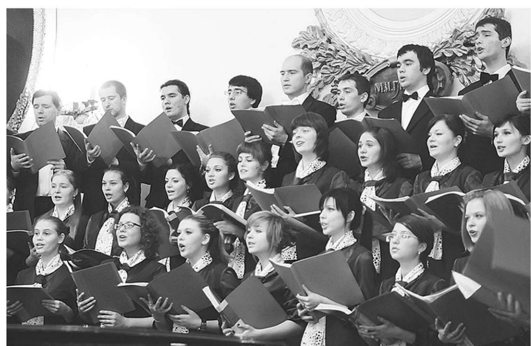
Поют студенты отделения хорового дирижирования.

Тридцать восемь молодых голосов начали юбилейный концерт в честь 85-летия дирижерско-хорового отделения старейшего нашего Воронежского музыкального училища (ему недавно исполнилось сто семь лет!) – колледжа имени Ростроповичей.