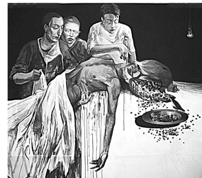
Одна из работ Кирилла Гаршина.

На открытии выставки Кирилл Гаршин заявил, что его работы – «сочетание мира Библии и мира шизофрении». В