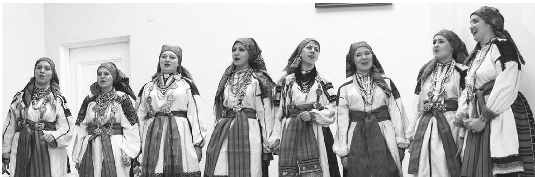
Выступает фольклорный ансамбль «Воля».