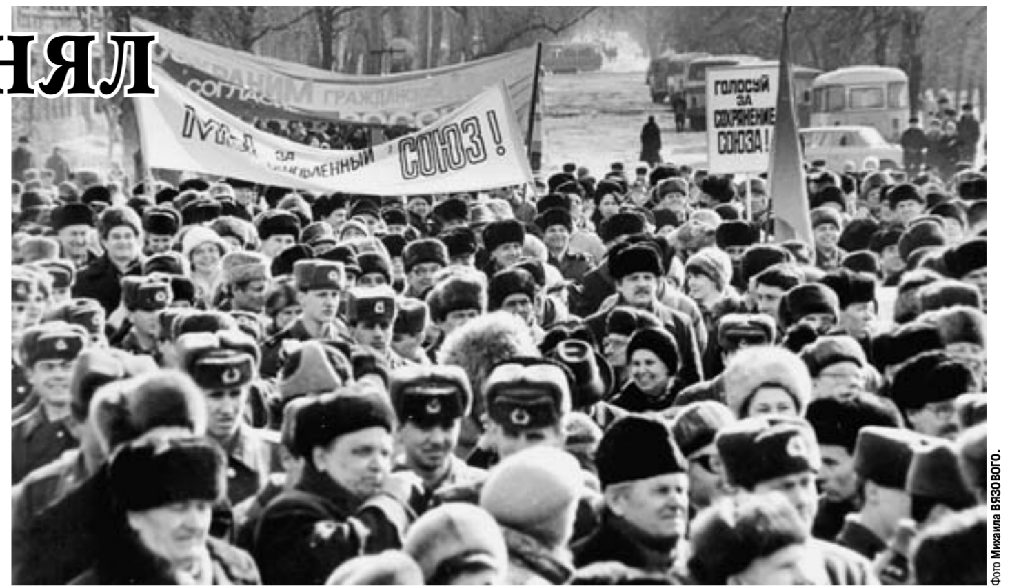
На митинге в поддержку сохранения СССР. Март 1991 года.

Шубин: За долгие годы советской жизни мы привыкли что-нибудь «получать» сверху, а надо не получать, а зарабатывать. Получать вправе пенсионеры и инвалиды. Посмотрите: каким красивым стал наш город. Посмотрите на воронежцев – они улыбаются и хорошо одеты. Посмотрите,