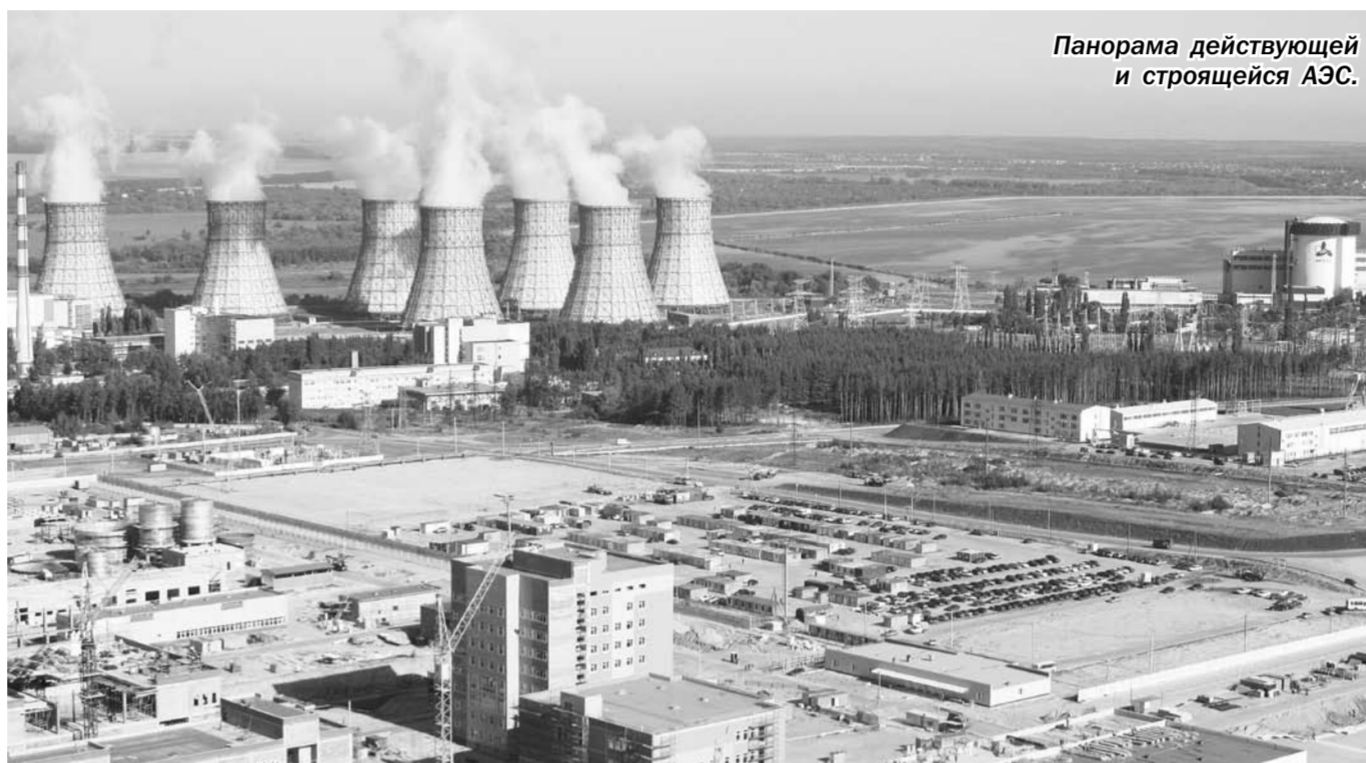
Панорама действующей и строящейся АЭС.

Сотрудники Нововоронежской первой атомной станции умеют работать по самым высоким стандартам безопасности