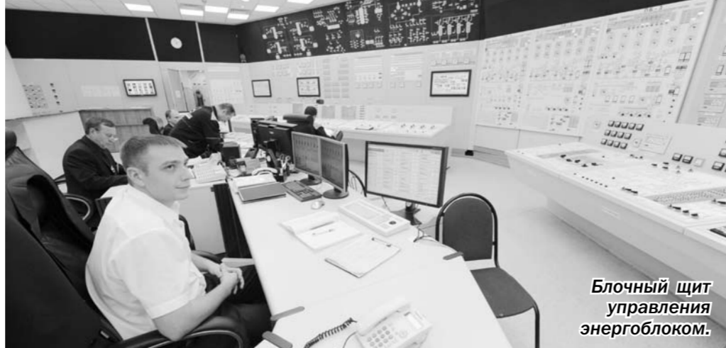
Блочный щит управления энергоблоком.

В тепловой энергетике – это средства защиты турбин. Все блоки находятся в работе, в том числе и пятый энергоблок за счёт модернизации получил возможность работать ещё 30 лет. Он полностью соответствует рекомендациям МАГАТЭ. Суть в том, что многолетняя эксплуатация энергоблоков ВВЭР-440 и головного – ВВЭР-100 первого поколения – показала их высокую надёжность. На их основе найдено технологическое развитие последующих блоков ВВЭР-1000. Все технические наработки после тиражирования на серийных блоках-миллионниках на Балаковской, Ростовской, Украинской и других АЭС. Но мы-то были первыми! Какое отношение к российским атомным станциям за рубежом, в частности, к НВ АЭС-1? Не обманусь, если скажу, что отношение к нам – трепетное. Около 15 тысяч специалистов из Чехии, Германии, Венгрии, Финляндии, Словакии, Китая, Ирана, Индии, а также бывшего СССР прошли стажировку и обучение в Нововоронежском учебно-тренировочном центре, на действующих блоках. И все они считают, что нововоронежская школа операторов-