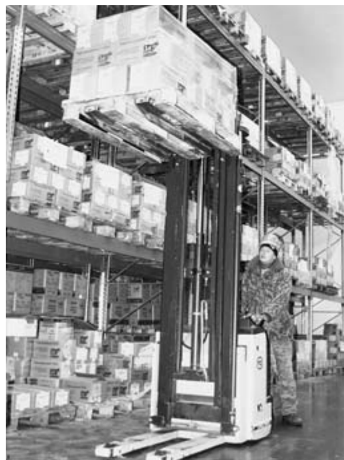
В этом модуле температура и зимой и летом одинаковая - минус 18°C.

Здесь, как и несколько лет назад, все живут идеей движения вперёд. И каждый день воплощает эту идею в жизнь. Значит, в летопись старинного русского села будут вписаны и новые яркие страницы.