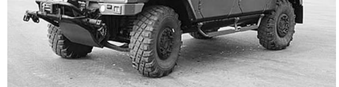
Подготовлено по сообщениям информационных агентств, пресс-служб и корреспондентов «Коммуны».

Бронированный автомобиль Iveco LMV M65 стоит на вооружении армий Чехии, Словакии, Великобритании, Австрии и Испании. Одной из отличительных особенностей его является высокий класс защиты – броня автомобиля выдерживает подрыв под днищем мощностью до шести килограммов тротила.