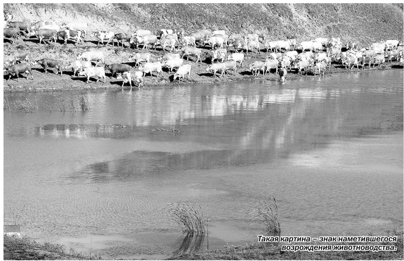
Такая картина - знак наметившегося возрождения животноводства.