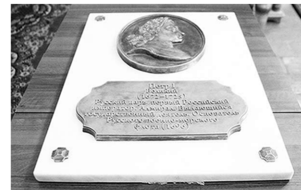
Памятная доска Петру I.