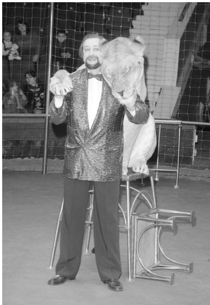
Народный артист РФ Николай Сквирский с львицей Асей.

Виктор СИЛИН Сразу отмечу, что праздничная программа «Львы Кенинг» под руководством известного дрессировщика народного артиста России Николая Сквирского – это ни в коем случае не шоу, а чистейшей воды настоящее цирковое представление, где во главу угла ставится трюк, что и отличает подлинное цирковое искусство от всяческой мишуры. На высочайшем уровне работает воздушная гимнастика на полотнах Лариса Багдасарова. Её номер – это безукоризненный слалом артистизма и сложнейших трюков. Давненько на арене не видно было жонглёров с диаболо. Достаточно редкий номер, в основу которого положена китайская игра «кундшу», впервые появилась на отечественном манеже 77 лет назад. Одним из тех, кто в совершенстве владел этим жанром, являлись наши земляки супруги Пикулины.