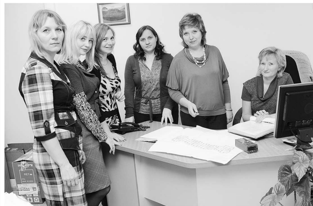
Сотрудники «Воронежоблтехинвентаризации» постоянно повышают свой профессионализм.

Увеличение нагрузки позволило заметно расширить штат филиалов БТИ, уделить больше внимания профессиональной подготовке их сотрудников. 85 процентов сотрудников БТИ имеют как минимум одно высшее образование. Многие в процессе работы получают второе высшее образование. Специалисты «Воронежоблтехинвентаризации» регулярно проходят переквалификацию, принимают участие в обучающих семинарах.