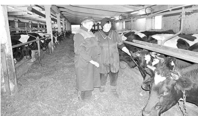
На животноводческой ферме.

ООО «Россия-АГРО» - одно из немногих хозяйств, где сохранили молочную, свиноводческую, овцеводческую фермы и занимаются развитием отраслей. Два года назад проведена реконструкция МТФ, ее модернизация, закуплен высокопродуктивный скот. На эти цели руководство хозяйства инвестировало 16 миллионов рублей. На ферме улучшились условия труда людей и содержания скота. Работники фермы используют эти преимущества с максимальной отдачей. В зимний период они поддерживают высокую продуктивность животных, обеспечивают стопроцентную сохранность полученного молока.