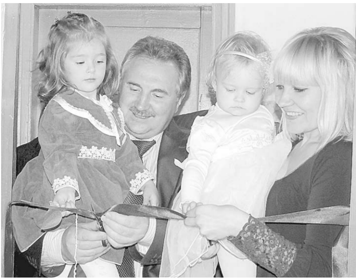
Александр Польшников с юными детсадовцами перерезает ленточку.

В ноябре новоселье новой группы справила детвора грибановского садика № 3 и Верхнекарачанского детского сада. Малыши получили новые игрушки. Поздравляя новоселов, глава администрации Грибановского района Александр Польшников отметил, что в детских садах открыта уже четвертая дополнительная группа. К концу года планируется открыть ясельную группу в детском саду № 1. Она станет новогодним подарком детям поселка от руководства района.