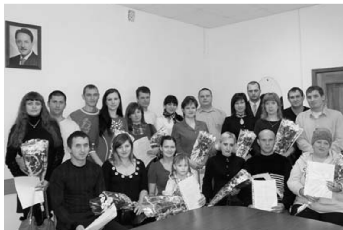
Молодым семьям – внимание и забота.

Далеко не все молодые семьи имеют возможность начать семейную жизнь в стенах собственной квартиры. Причин тому много: и финансовое положение молодых, и сложная ситуация на рынке жилья, и нехватка рабочих мест с достойной зарплатой, и многое другое.