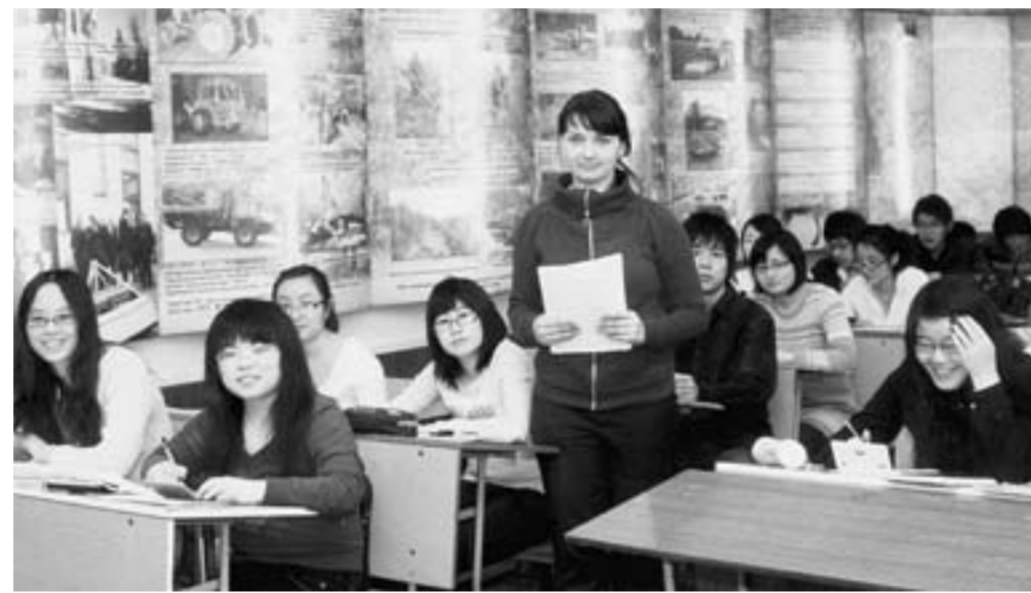
Китайские студенты на занятиях в стенах ВЛГТА.

Сейчас ряд выпускников-экономистов трудится в народном хозяйстве Китая, другие продолжают учёбу в Воронежской области в вузах России для того, чтобы получить степень магистра экономики, а затем пойти в аспирантуру.