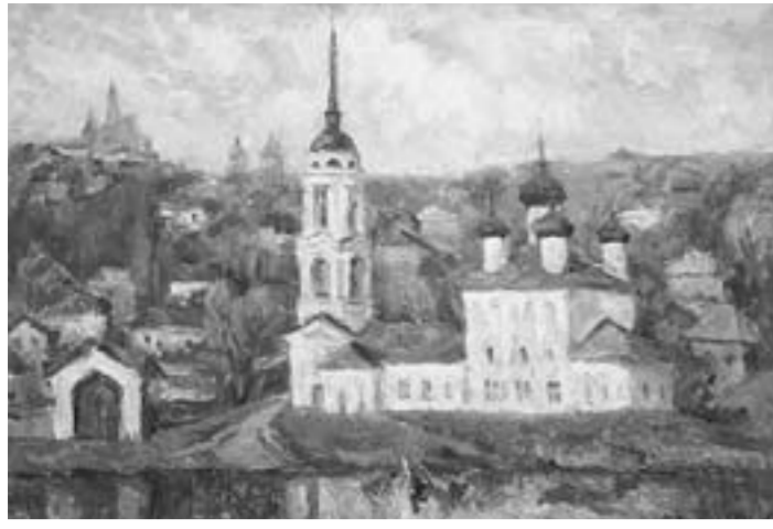
«Успенская Адмиралтейская церковь. XIX век».