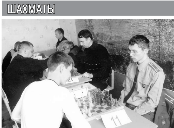
Играют участники турнира.