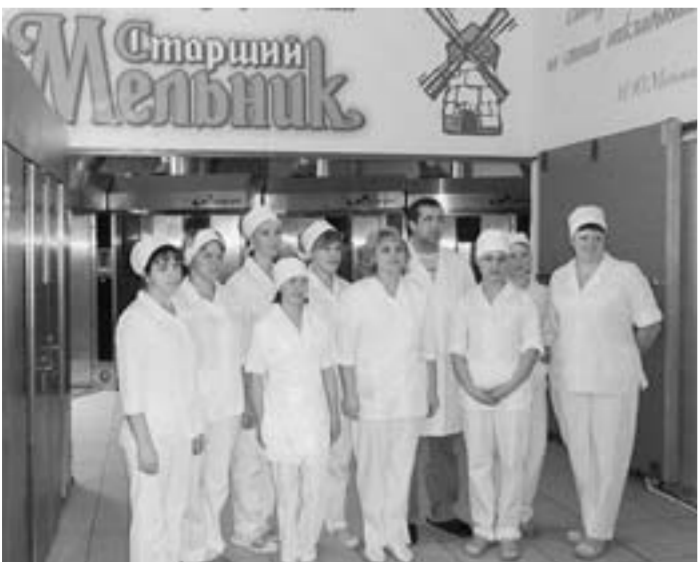
Вот они, кондитеры «Старшего Мельника».