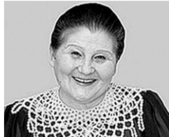
Екатерина МОЛОДЦОВА, народная артистка России.

Наш воронежский край сказочно красив, расположен в самом центре России! Мы гордимся, что на этой благодатной земле родились великие поэты и писатели: Никитин, Кольцов, Бунин, Платонов, основатель хора имени Пятницкого Митрофан Пятницкий. Поэтому у нас такой замечательный звонкоголосый воронежский хор «Воронежские девочки». Это наши певцы и музыканты поют во всех уголках России! А какие прекрасные у нас драматический театр, оперный театр, театр юного зрителя, кукольный театр. В них работают очень талантливые актеры. У нас песенный край с прекрасной, умной и талантливой молодежью. Я уверена, что нашим успехам всегда гордится вся Россия! Мои дорогие земляки, уважаемые воронежцы, я приглашаю вас всех прийти 4 февраля в 12.00 на Советскую площадь к театру драмы на общегородской митинг, который пройдет под девизом «Ты нужен Воронеж! Ты нужен России!».