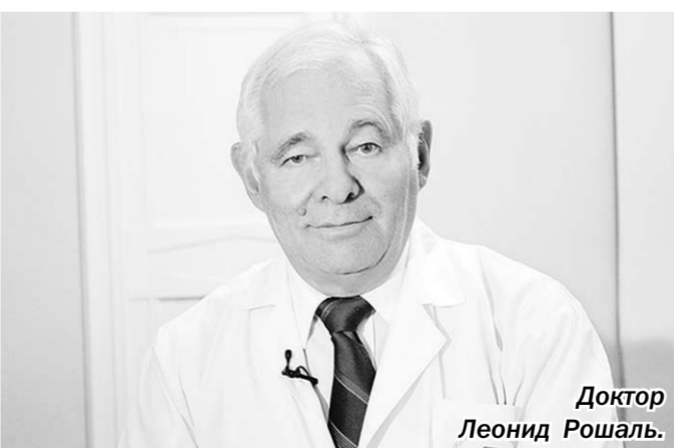
Доктор Леонид Рошаль.

«Медиков здесь оказалось около семисот человек. Многие пришли вовсе не потому, что верили Ельцину, а потому что могла пролиться большая