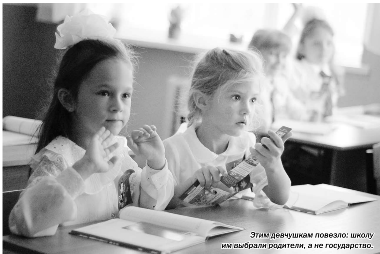
Этим девушкам повезло: школы им выбрали родители, а не государство.

Актуально | Министерство образования и науки в очередной раз решило внести изменения в правила приёма детей в школы