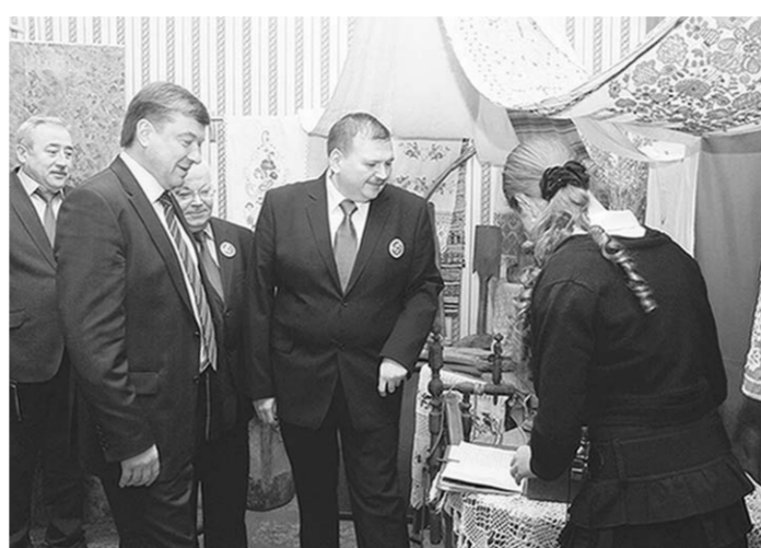
В школьном музее.