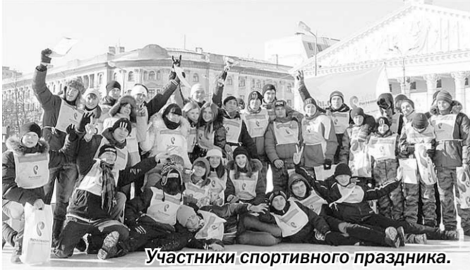
Участники спортивного праздника.