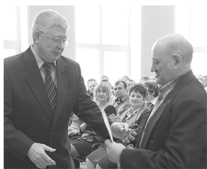
Ежегодно десятки сотрудников предприятия получают различные награды.

От нашей работы зависят благополучие и комфорт каждой семьи, качество жизни