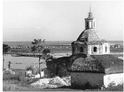
Нижний Карабут, сельский храм. 1942 год.

Придонские села и хутора юга Воронежской области минувшим летом вновь посетили паломники из Италии. Это были близкие и родные тех, кто пропал без вести в огне Великой Отечественной войны. Тех, кто пришли как волонтеры и подвальные захватчики. В Нижнем Карабуте Россошанского района зарубежным туристам местные жители вручили медальон погибшего альпийца. А недавно в знак благодарности итальянцы прислали фотографии тех давних лет. Особенно дорого то, что на одной из них запечатлен утраченный храм Михаила Архангела. Снимок теперь позволит восстановить церковь близко к ее первоначальному виду.