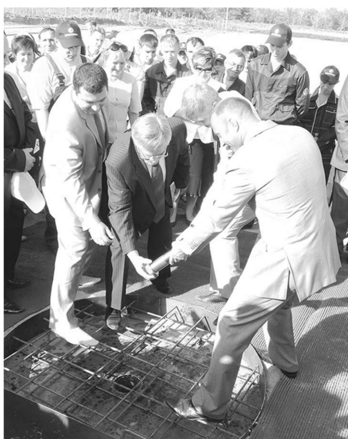
12 августа 2011 года на стройплощадке будущего завода в «Масловской зоне» прошла закладка памятной капсулы в его фундамент. А в августе нынешнего года «Воронежсельмаш» уже будет выпускать продукцию.

Из частных парков в Воронежской области я бы хотел отметить «Перспективу». Там планируются размещения производства мебели, лако-красочных материалов, металлоконструкций. Руководство «Перспективы» показывает пример того, как при грамотной работе можно добиваться замечательных результатов. Проект Руслан Групп пока в стадии формирования. А «Эласторгад» — это промышленный парк химических технологий на базе ОАО «Воронежсинтезкаучук». Реализуется на принципах частного государственного партнёрства при поддержке правительства Воронежской области.