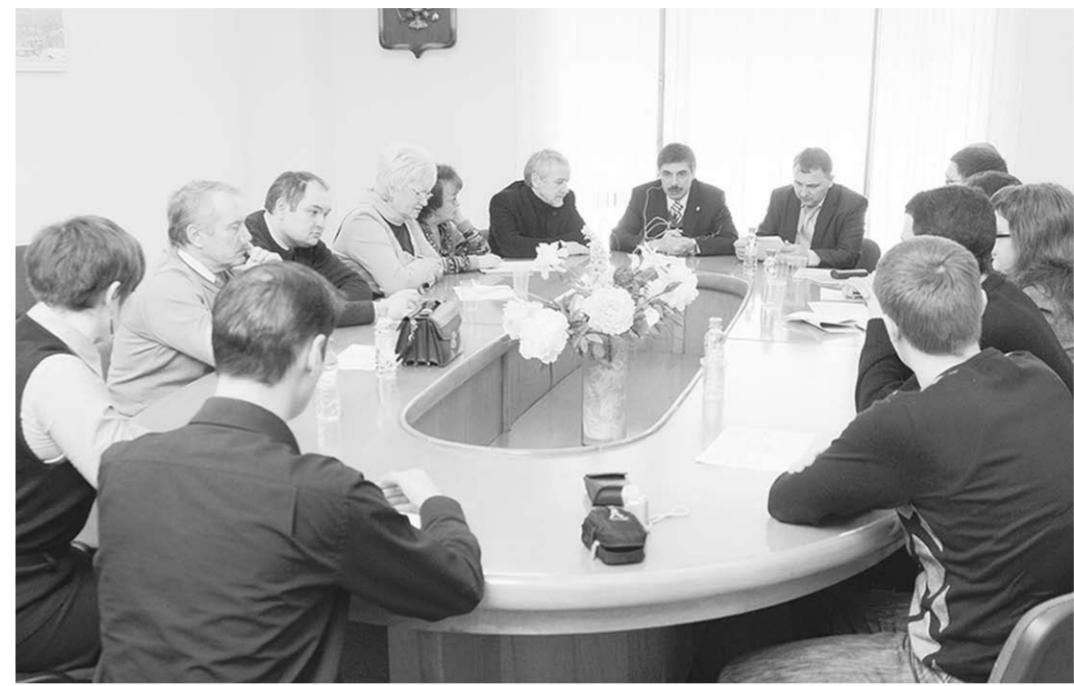
Участники «круглого стола».

Кроме того, важно подчеркнуть, что Украина весьма восприимчива и к новым европейским веяниям. Усиление национализма на западе страны прекрасно коррелируется с подобными феноменами в Венгрии, Нидерландах, Финляндии, Швеции и так далее. В Европе наблюдается правая трансформация, чему способствует катастрофическое па-