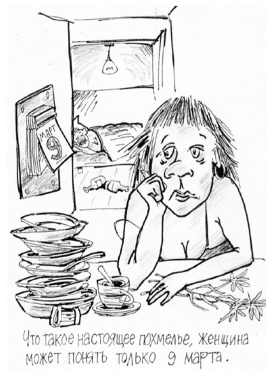
Что такое настоящее похмелье, женщина может понять только 9 марта.