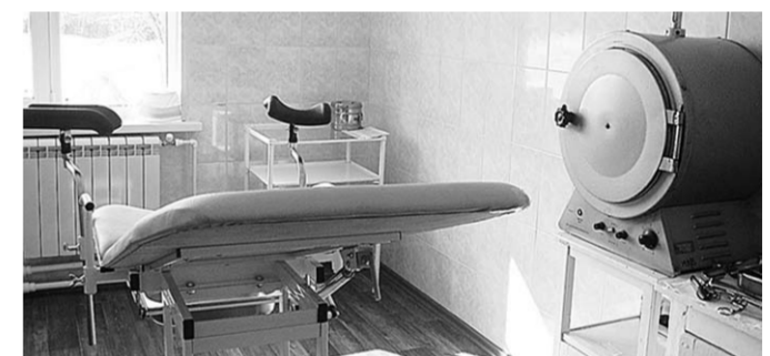
В новой участковой больнице, что открыта в селе Байчурово Поворинского района, всё сделано на совесть, здание стационара современное и уютное.