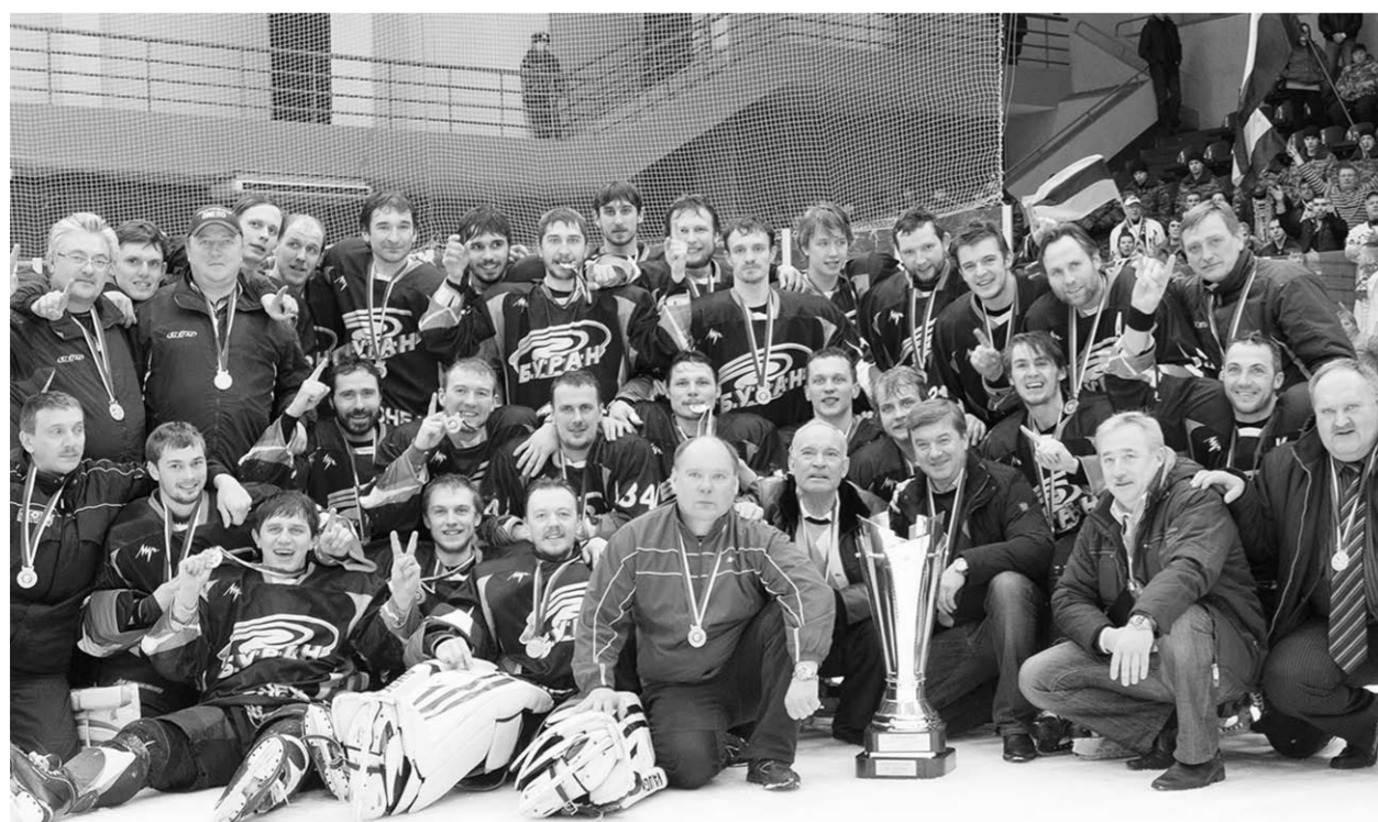
Радость у всех одна.

Событие | Хоккейный клуб «Буран» (Воронеж) стал победителем западной зоны Российской хоккейной лиги