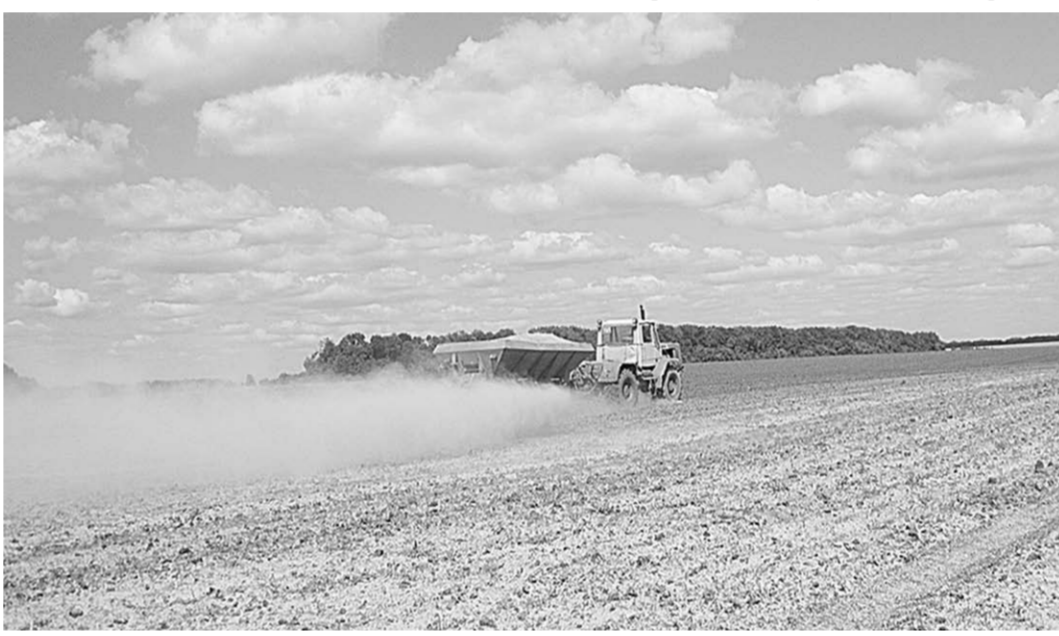
Внесение дефеката в ЗАО «Путь Ленина» Аннинского района.

Исследования показывают, что ежегодные потери кальция