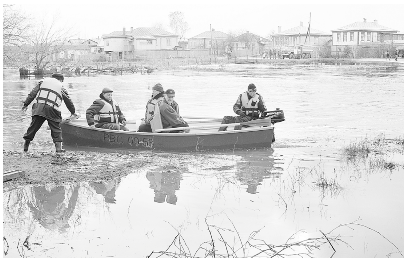
Для калачеевцев, попавших в зону бедствия, организованы лодочные переправы.

На тему дня | «Большая вода», о которой предупреждали спасатели, хоть и с некоторым опозданием, но всё-таки пришла. О паводке сегодня говорят на совещаниях у губернатора Воронежской области и пресс-конференциях