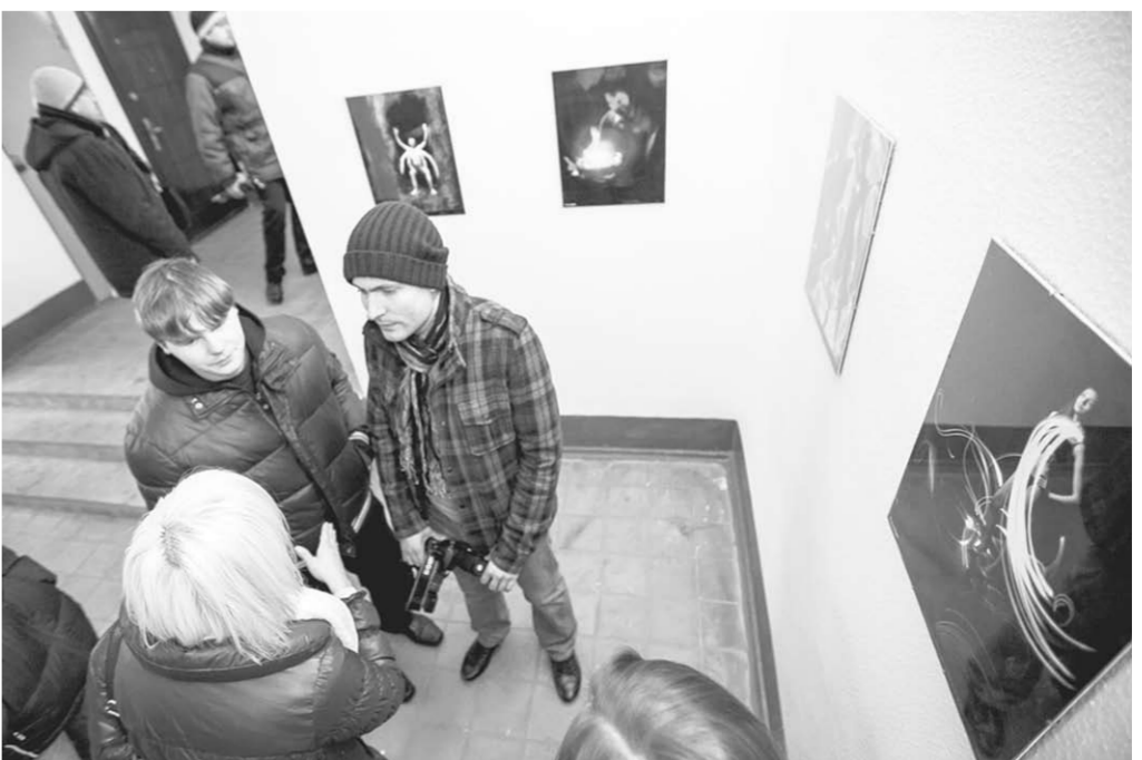
Подъезды дома преобразились.