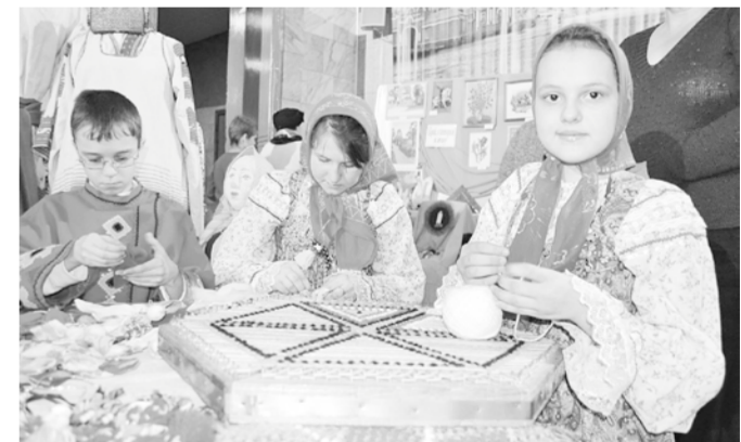
На фестивале «Адрес детства – воронежский край».