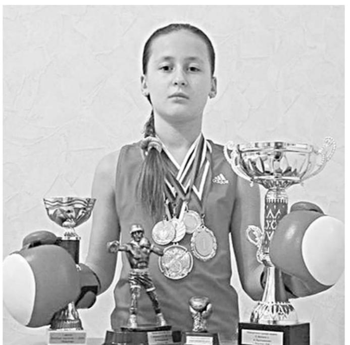
Надежда воронежского бокса.

– Дело не в боксе, а вообще в поддержке спорта. На Северном Кавказе, например, очень развиты спортивные единоборства, и молодежь там пьет и курит на порядок меньше, чем у нас. Но мы ведь тоже не стоим на месте. Раньше строительные фирмы возводили в Воронеже дома, сдавали – и все. Потом стали брать на себя их обслуживание. Еще потом во дворах стали возникать спортивные и детские площадки. И дальше, я верю, будет все лучше и цивилизованней. «Музей по соседству» оказался весьма сложным проектом – и в организационном, и в техническом смысле, но – глаза бояться, а руки делают.