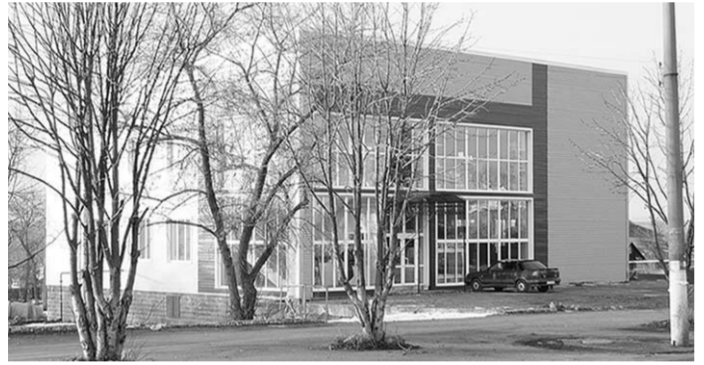
Новый торговый центр.

Два магазина «Подарки, сувениры» и «Парфюмерия» арендуют торговые площади на первом этаже.