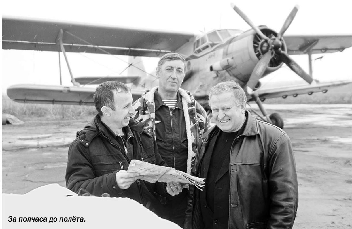
За полчаса до полёта.

Сельхозпредприятия приступили к весенне-полевым работам. Первый обязательный агроприём – подкормку посевных площадей минеральными удобрениями – земледельцы проводят как наземными средствами, так и с помощью самолетов сельскохозяйственной авиации.