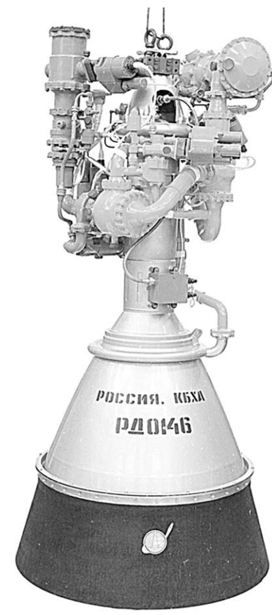
Кислородно-водородный ракетный двигатель РД-0146.

ного блока первой ступени новой ракеты легкого класса «Союз-2-1в», которое должно состояться в начале лета. Там установлен наш новый двигатель 14Д24, изготовлением которого занимается ВМЗ. Он вышел на этап завершающих доводочных и межведомственных испытаний. Первый полёт ракеты запланирован на четвёртый квартал этого года.