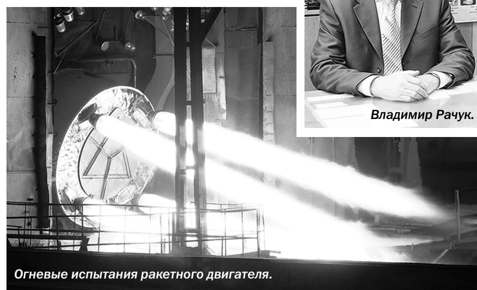
Огневые испытания ракетного двигателя.

Воронежская марка Конструкторское бюро химавтоматики разрабатывает двигатели для покорения космоса