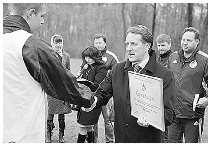
Губернатор вручает сертификат капитану команды.

Михаил Акулов отметил, что ОАО «РЖД» не отказывается от ранее анонсированных планов строительства скоростного участка железнодорожной магистрали из Курска через Белгородскую область с выходом в Россошь. «Реализация этого проекта - более далёкая перспектива», - уточнил он.