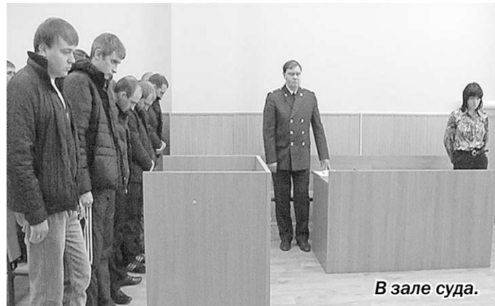
В зале суда.