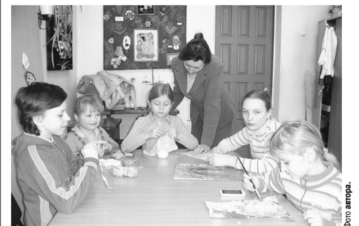
Юные поворинские мастерицы.

• Для сотрудников комплексного центра социальной защиты населения «Исток» и филиала отдела социальной защиты населения по Советскому району ко Дню социального работника оказана помощь на организацию праздничного стола • Советскому районному отделению Воронежской областной общественной организации Всероссийского общества инвалидов: • Ко Дню Победы оказана помощь на организацию праздничного стола для ветеранов и актива Общества • К весеннему субботнику приобретена краска и инвентарь для покраски цоколя и входной группы • Для организации Регионального слета молодых инвалидов «Все свои» оказана помощь на приобретение канцтоваров • Ко Дню пожилого человека и Дню инвалида оказана помощь на организацию праздничного стола • Оплачены работы по замене радиаторов системы отопления • Приобретена елка и новогодние подарки детям-инвалидам, а также детям из семей инвалидов • Негосударственному социальному учреждению «Творческий центр «Радуга» Воронежского отделения общественной организации Всероссийского общества инвалидов: • Ко Дню инвалидов получили подарки 87 членов ТЦ «Радуга» • Новогодние подарки получили дети-инвалиды и дети из семей инвалидов - членов ТЦ «Радуга» • Союзу семей военнослужащих, погибших в мирное время, оказана помощь на организацию праздничного стола.