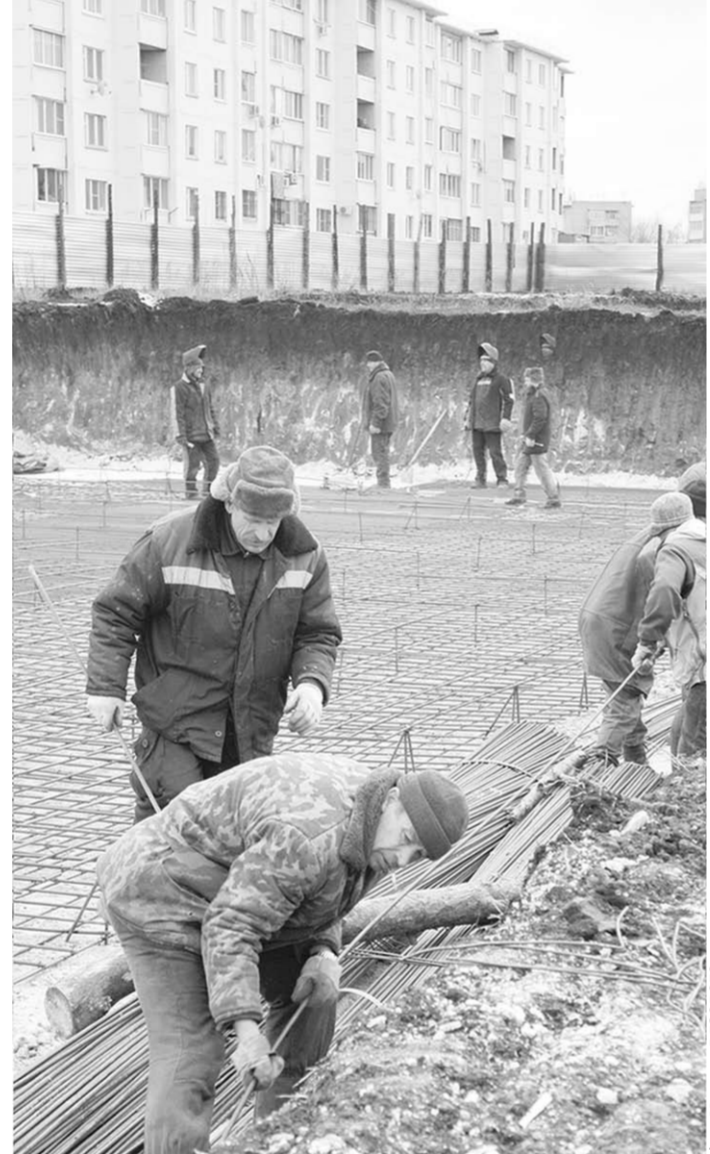
Семилуки – в лидерах по переселению из ветхого и аварийного жилья.

– Центральным местом, где развернутся праздничные мероприятия, станет парк Второй воздушной армии, на благоустройство которого выделяется значительная сумма – около пяти миллионов рублей. Уже сегодня там чистят пруд. На всей территории зоны отдыха планируется сделать новую линию освещения, отремонтировать памятник воинам Второй воздушной армии, уложить вокруг него, а также на главных аллеях парка свежую плитку.