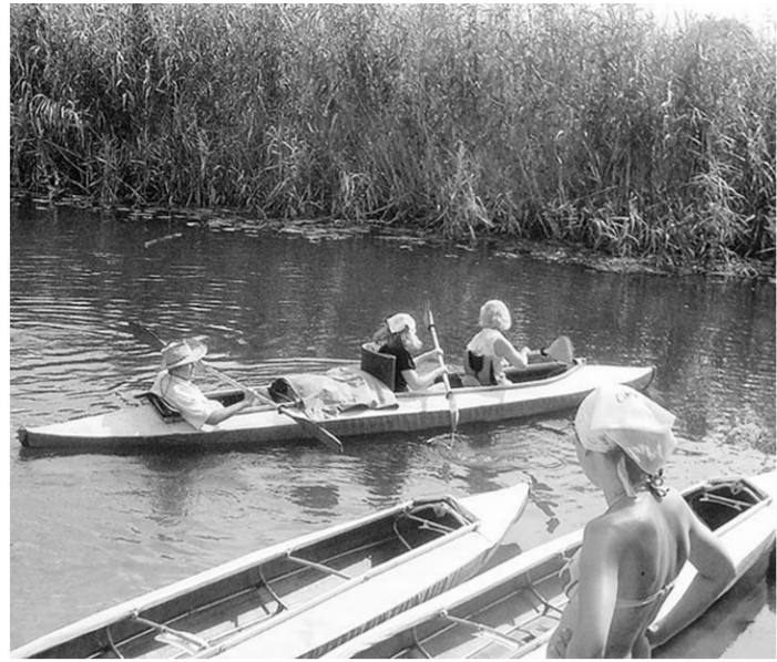
Начало похода на байдарках.