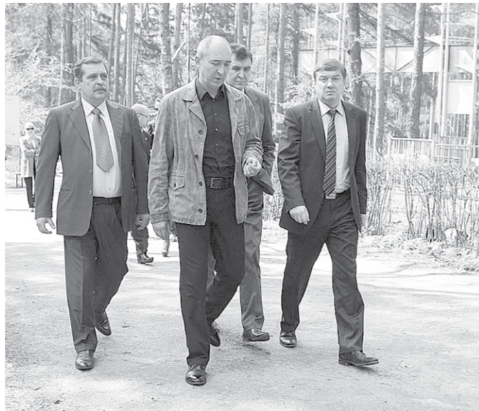
Мэр Колюх на дороге к лагерю.

— Необходимо уделять повышенное внимание к качеству проводимых работ, санитарным условиям, соблюдению мер противопожарной безопасности, — подчеркнул Сергей Колюх.