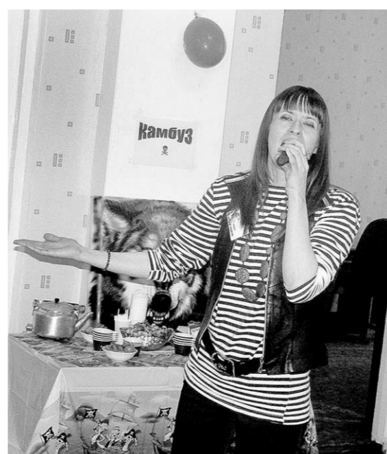
В информационно-сервисном центре гостей встретили песни.