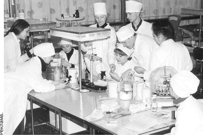
В учебной лаборатории.