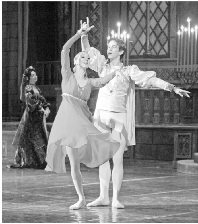
Сцена из балета.

И ты ей веришь. Доходит до того, что начинаешь слышать, будто в движениях танцовщицы звучат шекспировские слова, вложенные в уста Джульетты: «Я - воплощение ненависти силы, нежности, по незнанию любви», или же: «Ужель так бесцеремонно небеса? Чувствую «вибрацию слов над поверхностью танца». Так в своё время писали балетные критики о постановке Леонида Лавровского в Большом театре