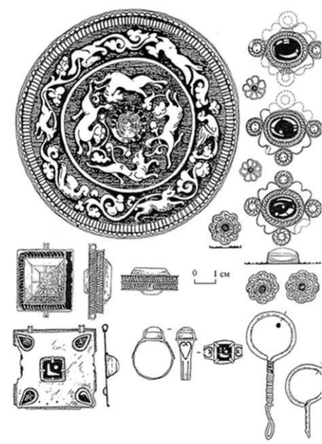
Зеркало, золотые украшения из погребения ханши.

Полный список тех предметов, которые сопровождали погребенных, занял бы не одну страницу. Назовем основные. Они дают основание говорить о том, что это были не простые кочевники, а представители высшего слоя кочевого общества: а мужчину, и женщину (для них устроили отдельные курганы) сопровождали в путь иной бронзовые котлы, серебряные чаши для питья – шалы. При женщине находилось зеркало из Волжской Булгарии из сплава серебра и олова с изображением животных, бегущих по кругу, золотые украшения – серги, перстень, напивные бляшки. Ханша, судя по фрагментам ткани, была одета в шелковые одежды, прошитые золотой нитью. У мужчины – кольчуга, железный шлем, серебряный пояс с позолоченными бляшками, на котором изображены итенец цапли, берестяной колчан со стрелами, копы, на окончании которого была насажена какая-то птица, стремена. Такие погребения археологи