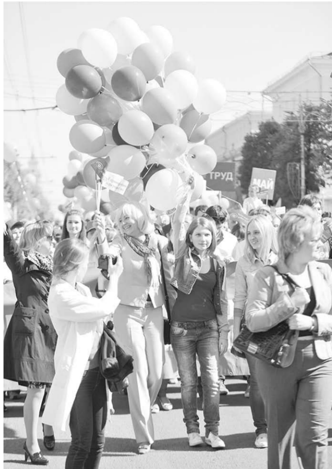
На волнах праздника.