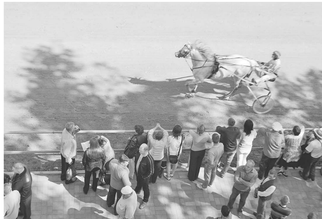
На ипподроме – захватывающие бега.