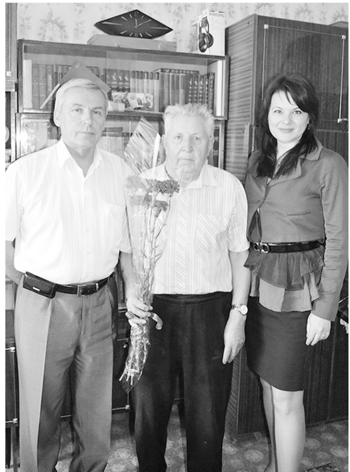
Ветеранов-газовиков поздравили лично руководители районных газовых служб и обособленных структурных подразделений.

Впереди международная научная конференция «Сражения на Дону: от Воронежа до Сталинграда. 1942-1943гг.», в которой примут участие историки 12 государств. Она в июне пройдет в Москве в Центральном музее Великой Отечественной войны на Поклонной горе и в Воронеже на базе ВГАУ. Конференция посвящается 70-летию сражений на воронежской земле.