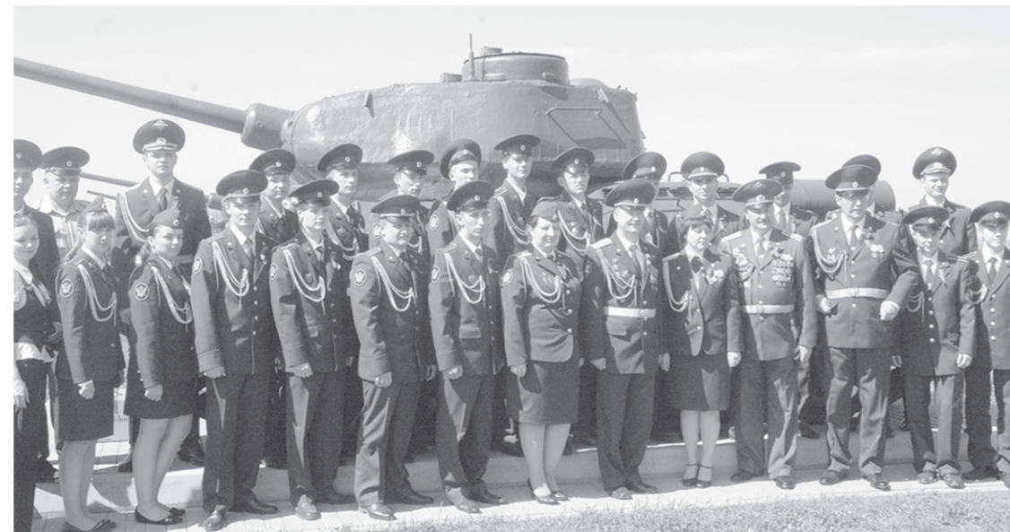
Фотография на память у танка Т-34 на Прохоровском поле.

У Вахты памяти, продолженной на ратоне Прохоровском поле, будут и новые адреса нашей Великой Победы.