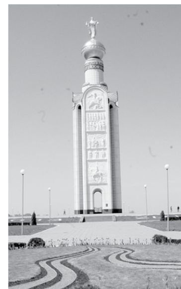
Так выглядит звонница.

танк на танке. Скрежет металла стоял невыносимый. Зато, когда мы подняли с десятков немецких «тигров», у большинства из нас страх прошёл, смелее в атаку пошли. Бой длился весь день, но мы выстояли. Да, нам было тяжело. Я видел, как гибли люди, как танки давили людей. Зато я знаю точно: под Прохоровкой победила дружба народов!