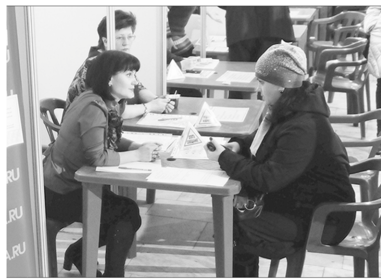
Идут консультации с работодателем.

ничество с трудовыми мигрантами из ближнего зарубежья. - Мы можем предложить соотечественников из 131 страны мира, так как наша компания входит в ассоциацию job-сайтов Network. К слову, на сайт HeadHunter в месяц заходят 8,5 миллиона пользователей в поиске работы, - отметил он. Сегодня с воодушевлением рассматривают в сторону зарубежных стран не только наши соотечественники, но и иностранцы. - Есть даже объединения англичан, работающих в Москве, в нём состоят 15 тысяч человек. Я по роду своей деятельности часто бываю за рубежом и могу сказать, что там очень консервативный