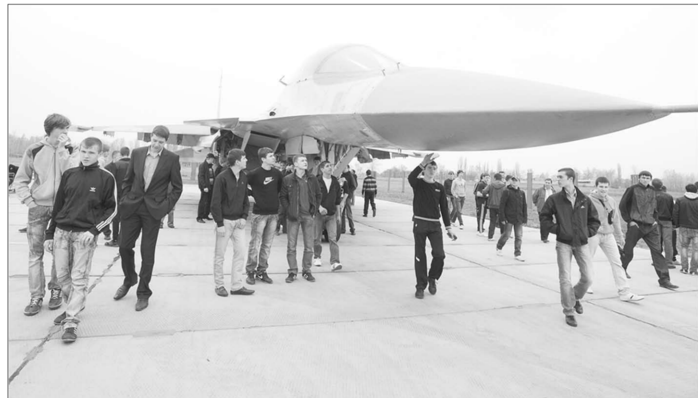
По плану призыва этой весной служить отправятся 3700 воронежских парней, 15 процентов из них – специалисты с высшим образованием. Большинство призывников распределяет по частям Западного военного округа.

То есть от трудовой миграции, как внешней, так и внутренней, нам не уйти.