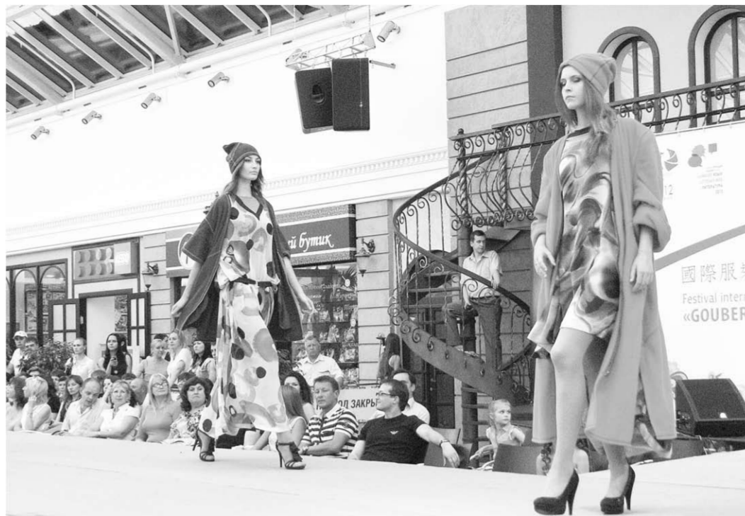
Модели на подиуме.

скрѐба Вячеслав Зайцев оценил красоты столицы Черноземья и отметил, что с момента его последнего приезда сюда город заметно преобразился. Архитектура и дизайн просто великолепны, появилось много зелени. Сюда очень приятно приезжать. Великий кутюрье Вячеслав Зайцев признался, что в последнее время увлекся фотографией и с удовольствием сделал несколько снимков. Помимо особенностей интерьера Центра Галереи Чижова, мэтр отметил костюмы персонала арт-шоу-ресторана «Балетан Сити», заявив, что они претендуют на звание «от кутюр». Я в восторге, здесь замечательная атмосфера, всё роскошно. Центр Галереи Чижова в самом сердце города великолепен. Чувствуется хороший дизайнер и руководитель, который создал этот проект, считаю, просто уникальный человек. Я очень много езжу по миру, но такое многообразие образов и стилей вижу впервые! После столь насыщенного дня пришло время дефиле. В ресторанном дворике Центра Галереи Чижова собралось несколько тысяч человек. Все гости отмечали высокий уровень организации показа. Согласились с ними и молодые дизайнеры: