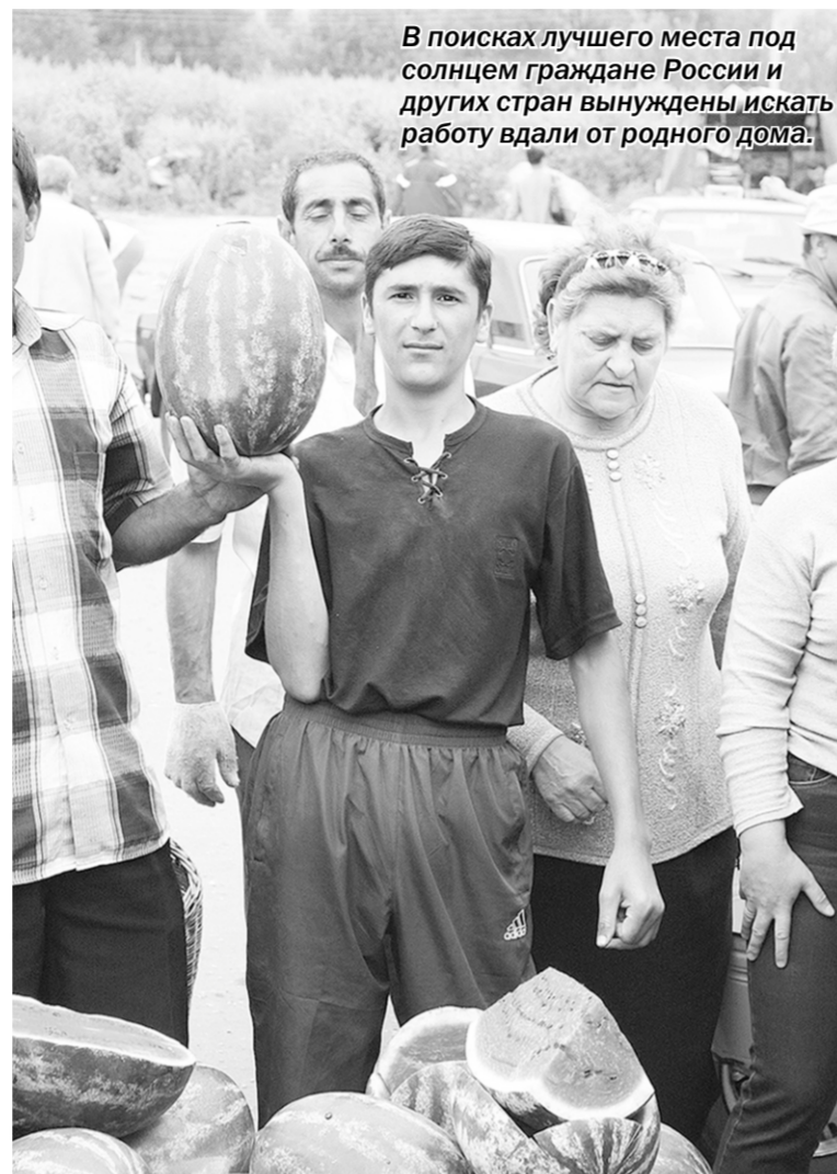
В поисках лучшего места под солнцем граждане России и других стран вынуждены искать работу вдали от родного дома.