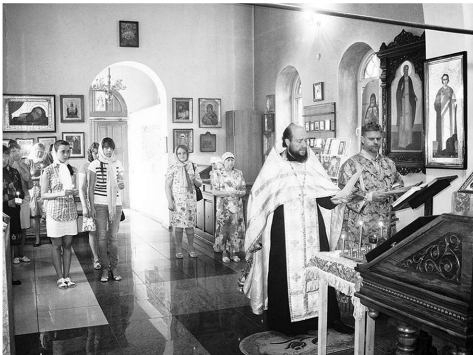
Панихида по умершим от СПИДа в храме св.Татианы.