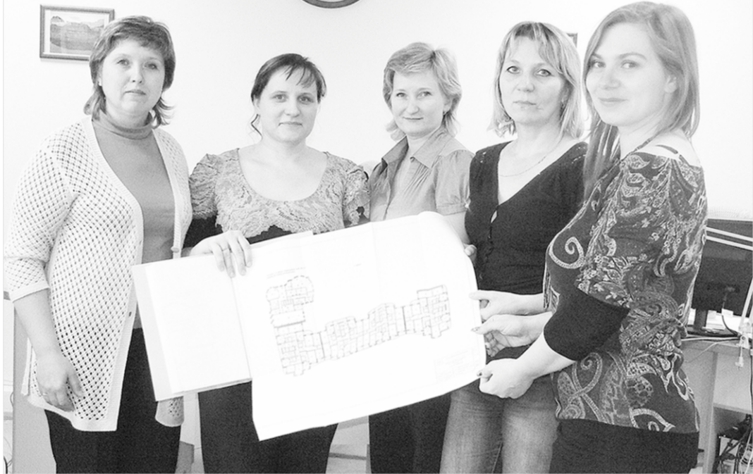
Коллективу БТИ все задачи по плечу.

определённые виды деятельности. В одном районе, например, хорошо развиваются такие виды услуг, как оценка недвижимости и техническая инвентаризация. В другом – геодезия. В третьем – архитектурно-проектно-инженерные работы.