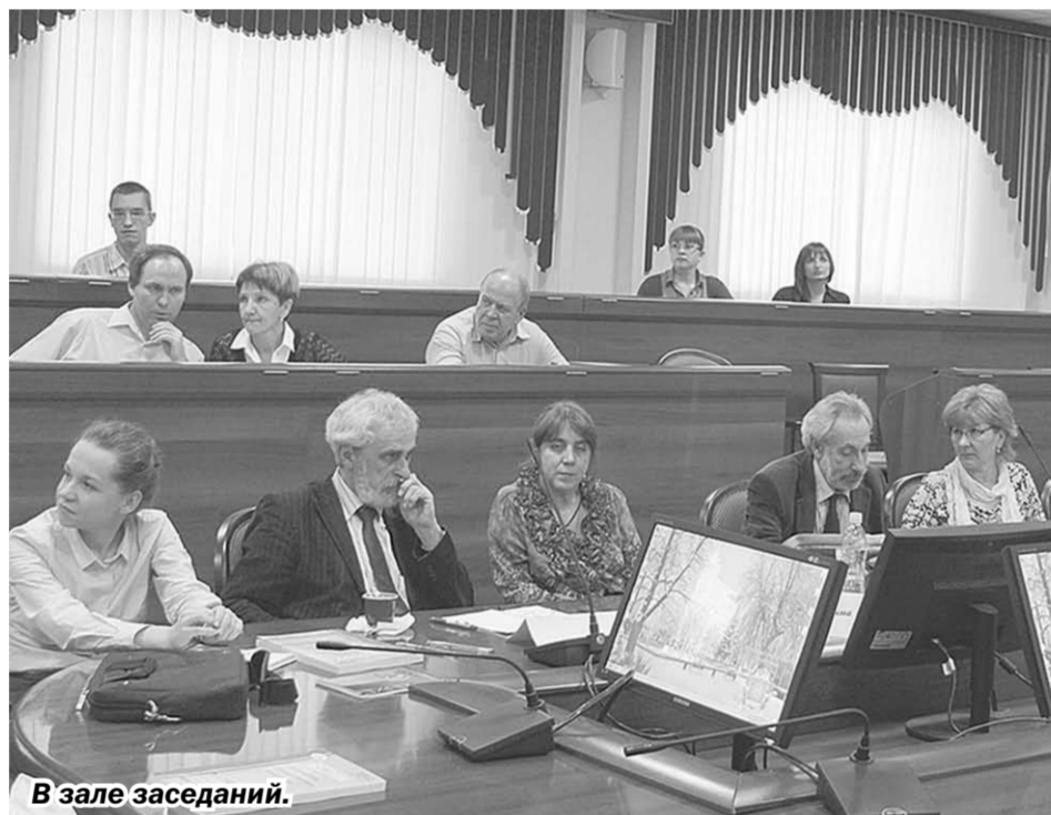
В зале заседаний.

Если оценить результаты совместной инновационной работы всех компонентов, можно сказать, что они очень хорошо проявляются в двух конкурсах, которые мы ежегодно проводим: «Инженер года» и