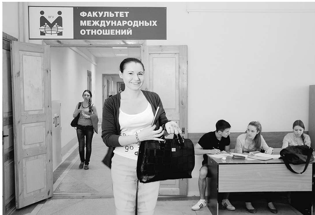
Даже самые сложные экзамены - на «отлично»!

На сегодняшний день факультет международных от-