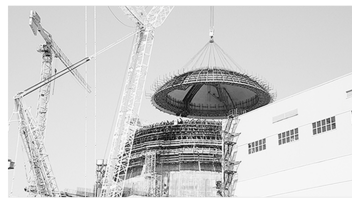
Идёт установка купола.

Окончание работ на этом участке даёт старт монтажу основного технологического оборудования реакторного отделения: корпуса реактора, парогенераторов, главного циркуляционного трубопровода. Внутренняя оболочка здания реактора, частью которой является купол, - основной элемент системы локализации и защиты. Двойная оболочка реакторного здания исключает выход радиоактивности в окружающую среду и служит физической защитой от природных и техногенных внешних воздействий, включая землетрясения, ураганы,