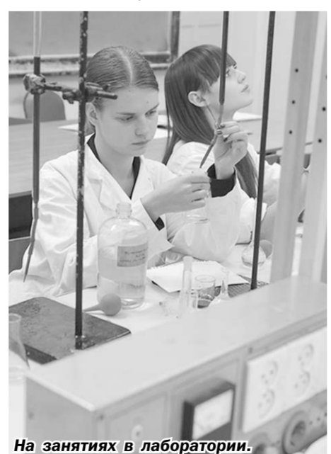
На занятиях в лаборатории.

«Единый день распределения выпускников» завершился. И хотя окончательные итоги его работы подводить пока рано, есть повод продолжить выбранный вузов курс. Результатом мероприятия стали заключённые между ВГУИТ и компаниями-