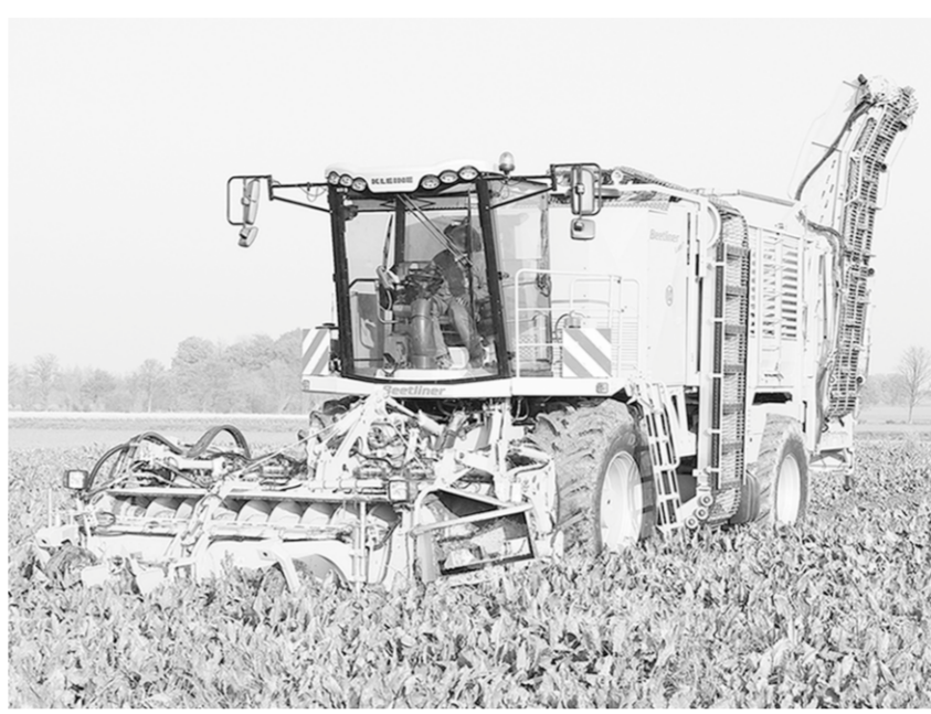
Свеклоуборочный комбайн Beetliner Large.

Индивидуальная конфигурация техники способствует её оптимальной адаптации к условиям работы. Благодаря этому значительно снижаются