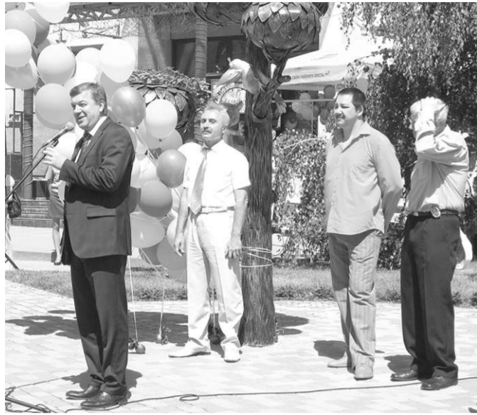
«Нет в мире города лучше, чем Воронеж», - пел Котёнок, а официальным лицам на празднике оставалось только повторить замечательные слова.