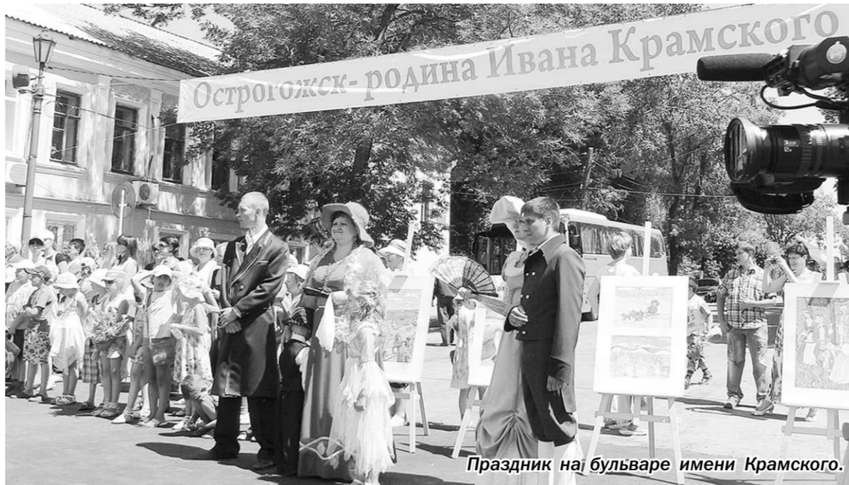
Праздник на бульваре имени Крамского.