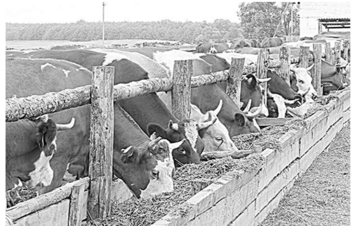
В рационе на ферме – летнее меню.