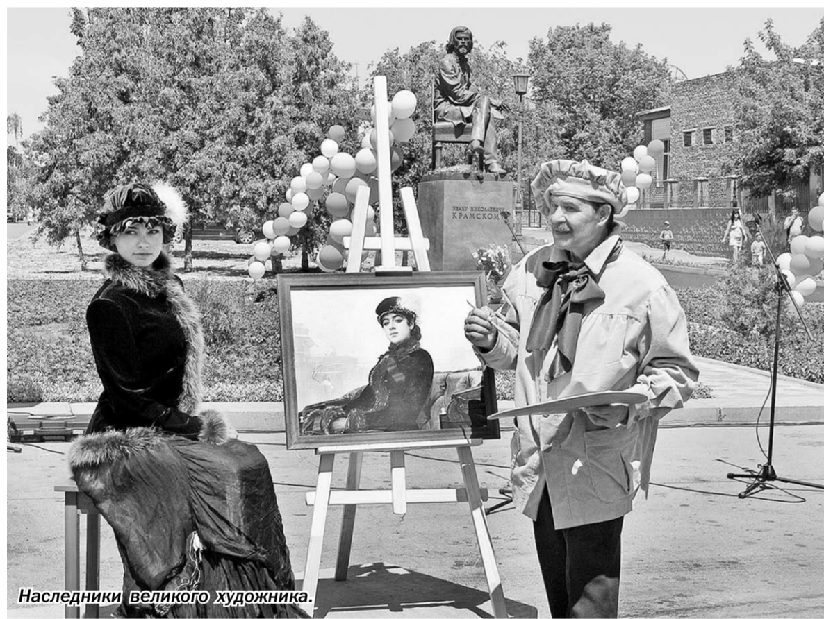
Наследники великого художника.

Опрос проведён институтом «Квалитас», в нём участвовали 627 человек. Выборка репрезентативна для населения Воронежские старше 18 лет по полу и возрасту.