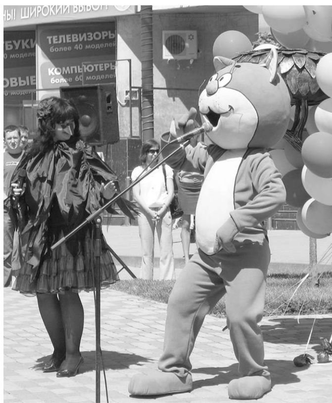
Для детей лучшего подарка, чем общение с Котом и Вороной, и не придумать.

Нарядные девочки выполнили почётную миссию - преподнесли пришедшим на праздник Коту и Вороной ножницы для разрезания верёвочек, на которых держались разноцветные воздушные шары, закрывавшие обновлённую скульптурную композицию. Шары пёстрыми