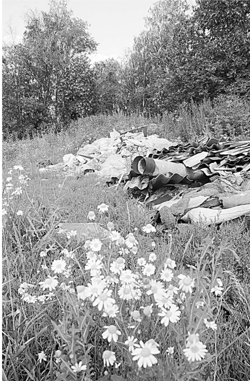
К сожалению, подобные свалки - не редкость для районов Воронежской области.