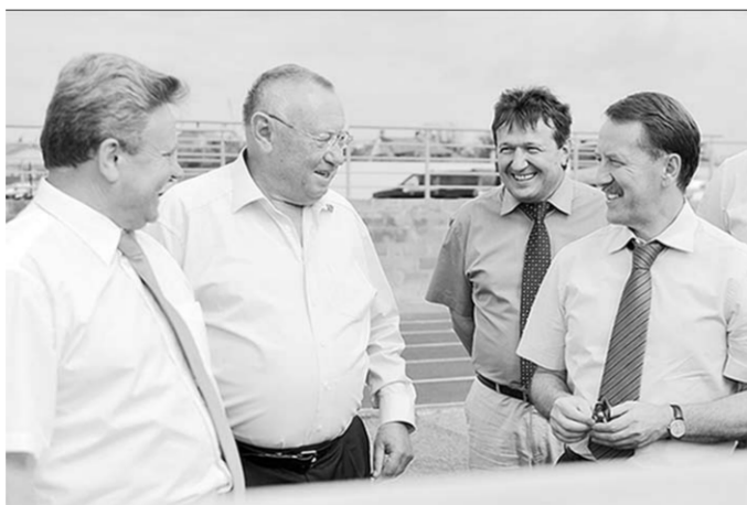
Новый стадион в Россоши открыт для всех желающих.

Завершения возведения комплекса ждёт и спортивная детско-юношеская школа олимпийского резерва. Глава администрации попросил губернатора помочь в решении