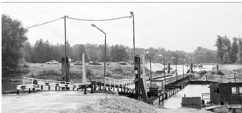
Паром на реке Дон теперь заменили понтонным мостом. Конструкции собрали на Павловском судостроительном заводе.

О социально-экономическом развитии региона шла речь и в Верхнемамонском районе. Здесь губернатор побывал на недавно установленном понтонном мосту через реку Дон стоимостью 49 миллионов рублей. В эти дни прокладывается автомобильная дорога Ольховатка – Старая Калитва, соединяющая два района. Верхнемамонский участок дороги