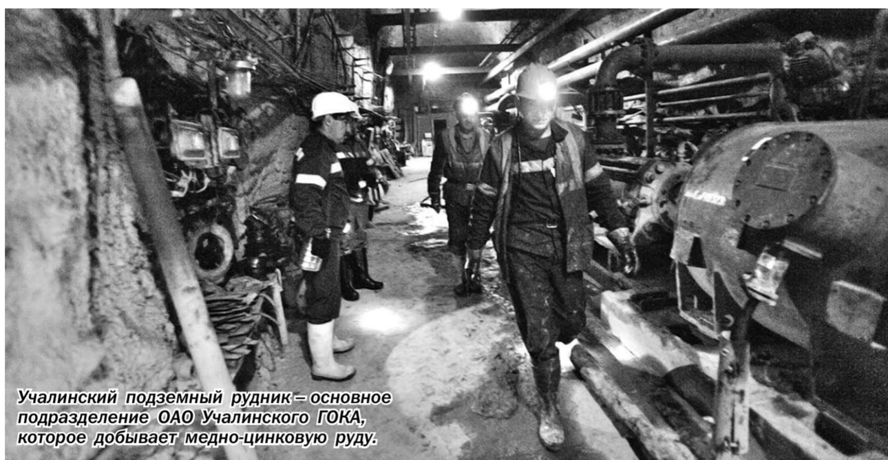
Учалинский подземный рудник – основное подразделение ОАО Учалинского ГОКА, которое добывает медно-цинковую руду.

Актуальная тема | Будущие разработчики медно-никелевых месторождений организовали пресс-тур для воронежских и волгоградских представителей СМИ