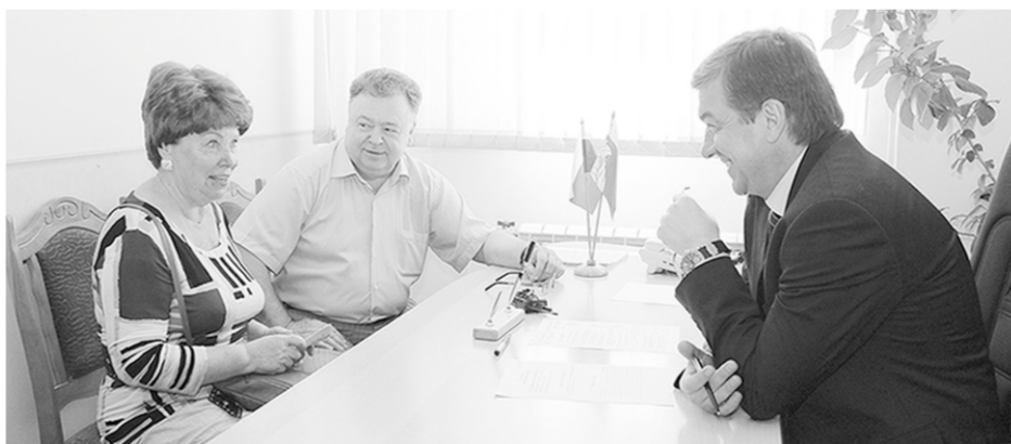
На приём к мэру люди шли с конструктивными предложениями.

– Это хорошо, но не забывайте о комплексном подходе. Управляющая компания должна выполнять ремонт дома – входных групп и т.д. Перечень всех работ и эскизный проект согласуйте с жителями дома, учтите их пожелания. Не забудьте про подъездные пути к дому