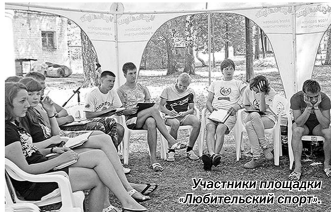
Участники площадки «Любительский спорт».