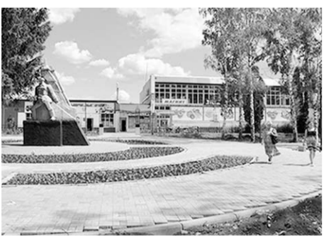
В центре посёлка Грибановский.

В центре поселка Грибановского благоустроивается парк. Каждый раз, проходя мимо, жители обращают внимание на то, что он день ото дня становится краше. Здесь высажены тротуарные дорожки, сделана красивая изгородь, посажены цветы, молодые деревья. Все это радует глаз.