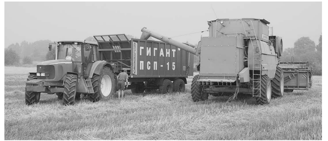
В уборочную страду ПСП-15 «Гигант» за счёт сокращения количества рейсов экономит время и топливо.

Пятнадцатитонник ПСП-15 «Гигант» благодаря большой вместимости – до 38 кубов – способен сократить количество рейсов и тем самым экономит