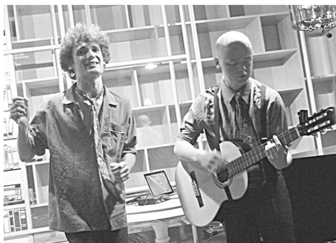
Одним из открытий «Культпохода» стал дуэт «Банана-Бис».

Например, стихи про чудо-дерево читал актёр, переодетый Сталиным, и это было чертовски убедительно. К нескольким молодым актёрам – участникам