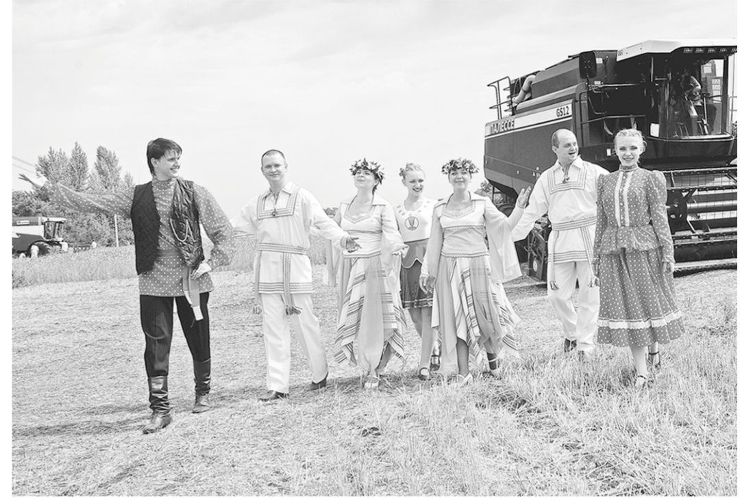
Звонкие песни из Гомеля – в поддержку комбайнов «Палессе».

Средой экспонатов, размещенных под жарким июльским солнцем, занимает техника Amazone. Amazone-Werke – это всемирно известная немецкая фирма. Её визитом много лет служат слова Конфуция, сказанные ещё за пять веков до рождения Христа: «Не заботься о жатве, но заботься о правильном возделывании