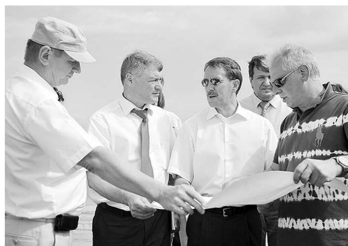
Алексей Гордеев на строительстве сельскохозяйственного объекта в Нелже.

Муниципальный контракт с подрядчиком расторгнут 15 июня. Будем искать