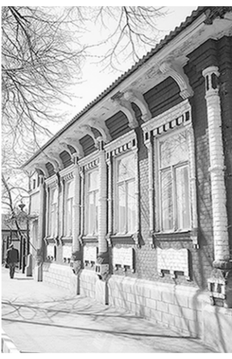
Одно из старинных зданий Бутурлиновки.

Из областного бюджета выделено 5 млн. рублей на капитальный ремонт дорог.