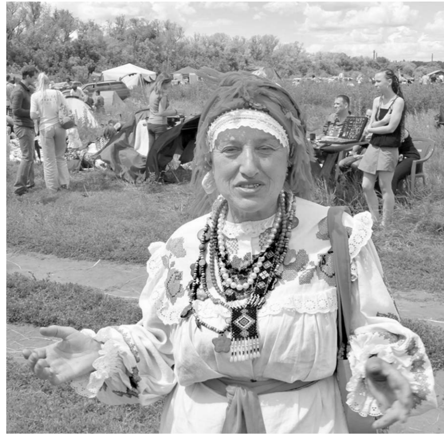
Нет ничего милее родины.