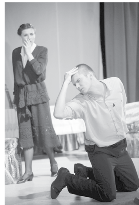
Сцена из спектакля «Дорогая Елена Сергеевна».