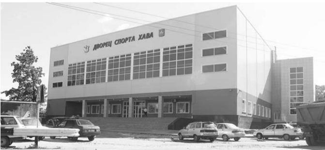
Спорткомплекс в Верхней Хаве.

Другая значительная часть спорткомплекса – бассейн. Современные инженерные сооружения позволяют контролировать тепло и влажность воздуха, осуществлять бесперебойную очистку и смену воды.