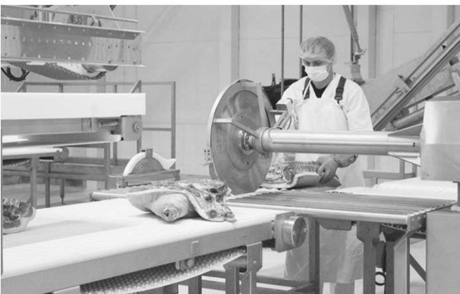
Идёт разделка мяса.

Его уникальность ещё и в другом. К этому мясоперерабатывающему комплексу проявил интерес научный центр сердечно-сосудистой хирургии им. Бакулева. Та технология, которая будет применяться на заводе, позволит центру заготавливать биологический материал, необходимый для проведения операций на сердце маленьких и взрослых пациентов.