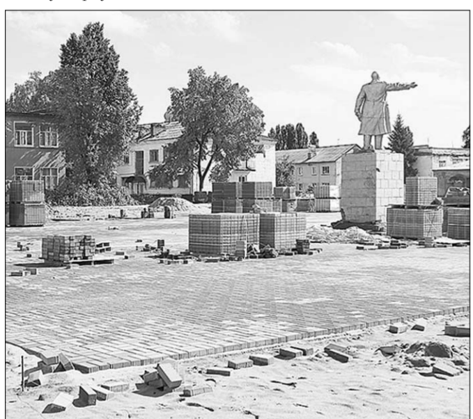
Идет благоустройство райцентра.

Идет и расчистка площадки, которая выбрана на месте старого парка у здания кинотеатра «Восток». В нынешнем году на этом месте запланировано разбить детскую игровую площадку, проложить центральную дорожку и установить входную арку.