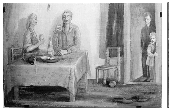
«Родители пьют кровь и слёзы своих детей».

Названию для своей выставки она придумала сама: «Человек, вошедший в ХХI век советским, добрым и красивым». Место проведения кажется неожиданным лишь на первый взгляд. Всё-таки «репертуарная политика» «Х.Л.А.М.» подразумевает эстетическую строгость. На проходящих в этих стенах коллективных вернисажах добродушно соседствуют, к примеру, сотворённые основателями Воронежского центра современного искусства инсталляции и образчики народного искусства.