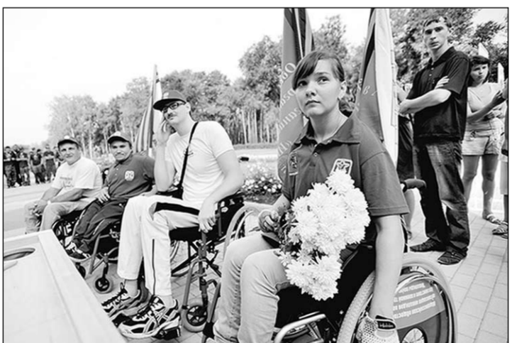
Каждый день они доказывают себе и другим, что являются полноправными членами общества.

Инициатором проведения марафона «Сильные духом» является Общероссийская обществянная организация ин-