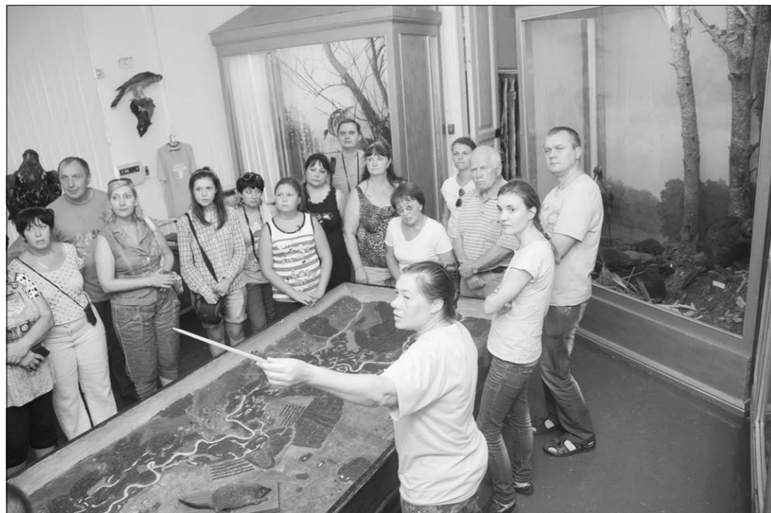
В музее можно увидеть редкие виды птиц и животных.