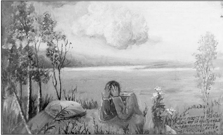
«Враги сожгли родную хату».

Творчески откликаться на злободневные темы художница начала давно. Так, одна из наиболее выразительных и трогательных её картин с неожиданным поэтичным названием «Родители пьют кровь и слёзы своих детей» датирована 1986 годом и явно была вдохновлена развёрнутой антиалкогольной кампанией. К 2012 году конкретный повод, впрочем, давно забылся, картина от этого стала лишь лучше.