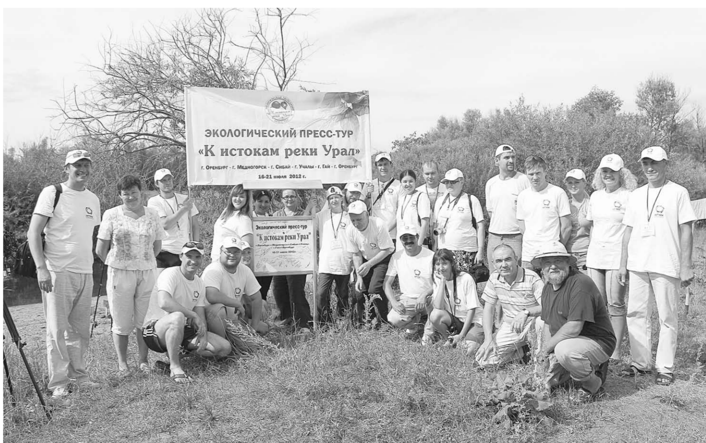
Участники экологической экспедиции «К истокам реки Урал».