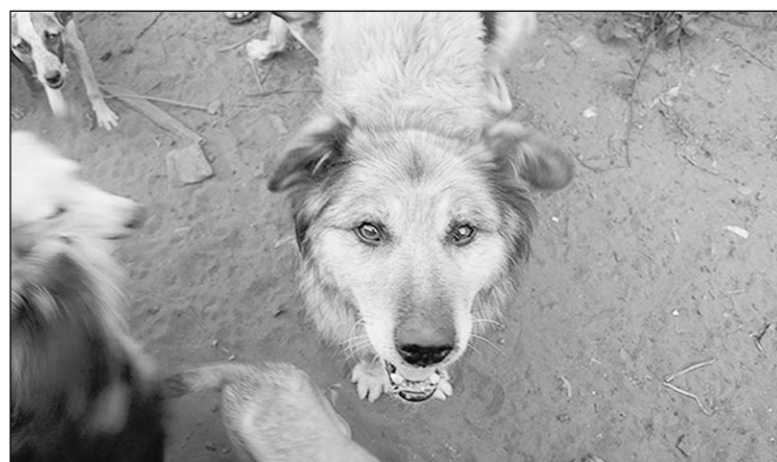
Эти глаза смотрят в нашу душу.