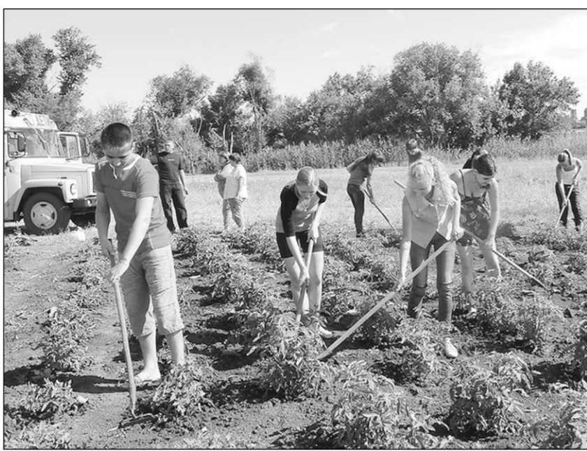
Утро у ребят начинается на грядках.

Ученическая производственная бригада здесь существует с 1959 года. Во время, не имея своей земли, она помогала колхозу «Путь Ленина», ухаживая за посевами и собирая урожай. В 1965 году из числа учащихся девятых классов создали группы животноводов, механизаторов, электриков, столоваров. В 1970 году ребята обрабатывали посевы подсолнечника, кукурузы, сахарной свеклы – до 200 гектаров ежегодно. С 1972 года для членов бригады организовали лагерь труда и отдыха. В 1979 году школе передали участок, где выращивались