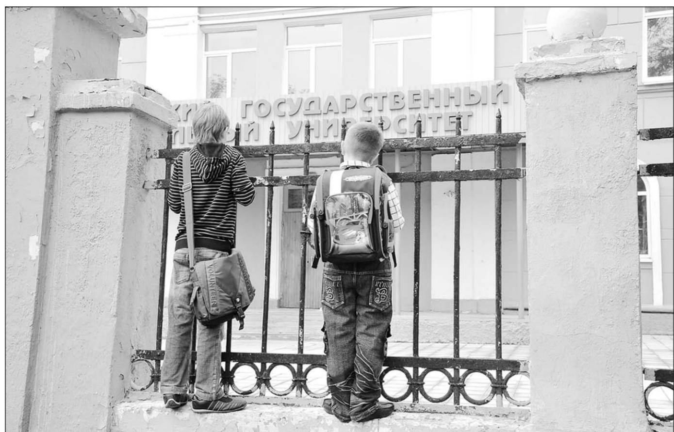
Ещё вчера утром эти мальчишки не знали, смогут ли они и дальше учиться в своей школе.

В 2002 году в Воронеже начался уникальный эксперимент по непрерывному образованию «школа – вуз». Между городской администрацией и руководством Московского государственного социального университета (так тогда назывался РГСУ) был подписан договор, по которому вуз получил в безвозмездное пользование на 49 лет здание ликвидированной средней школы №41 по улице Героев