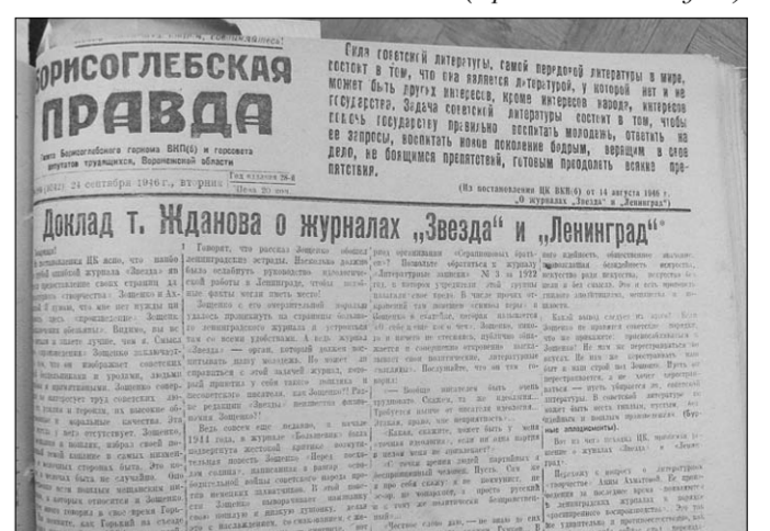
Доклад Андрея Жданова о журналах «Звезда» и «Ленинград» занял весь номер «Борисоглебской правды»