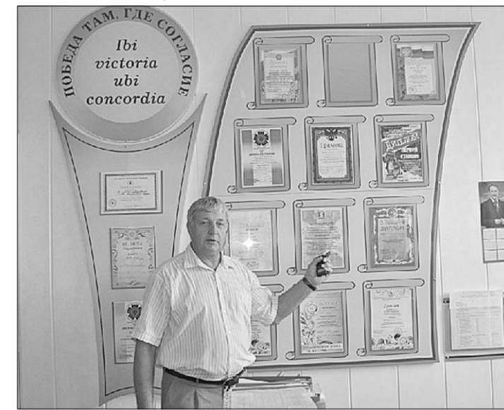
40 лет – на благо родного колледжа.