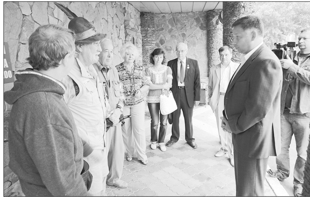
Итальянские гости на россосханской земле.