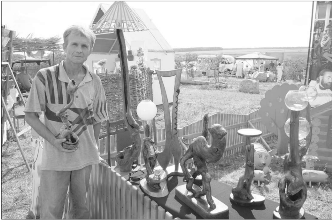
На то, чтобы «разгадать» корень, порой может уйти несколько месяцев.

Если по-научному, то такой вид творчества называют корневая пластика. У любого изделия, выполненного в этом стиле, всегда два автора – природа и человек. При этом для работы не требуется специального образования, главное – богатая фантазия.