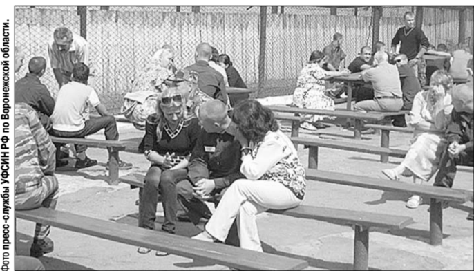
Долгожданные минуты общения.

Но самым долгожданным моментом стало общение родителей и детей, которого те с нетерпением ждали.