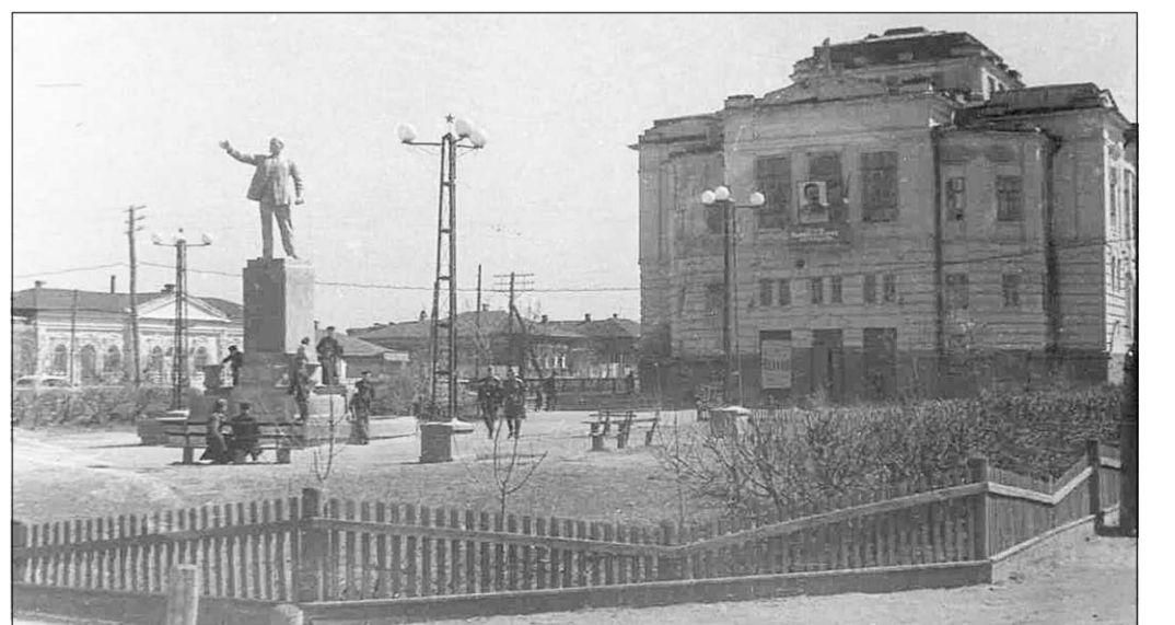
Борисоглебский театр, 1953 г.

* Скорее всего, имеется в виду писатель Александр Боршаговский