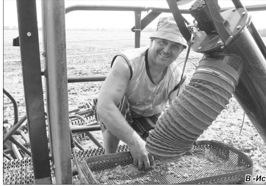
В «Истобном» уже положено хорошее начало будущему урожаю 2013 года.

Подготовили Елена ЗЕЛИКОВА, Наталья СТОЛПОВСКАЯ.