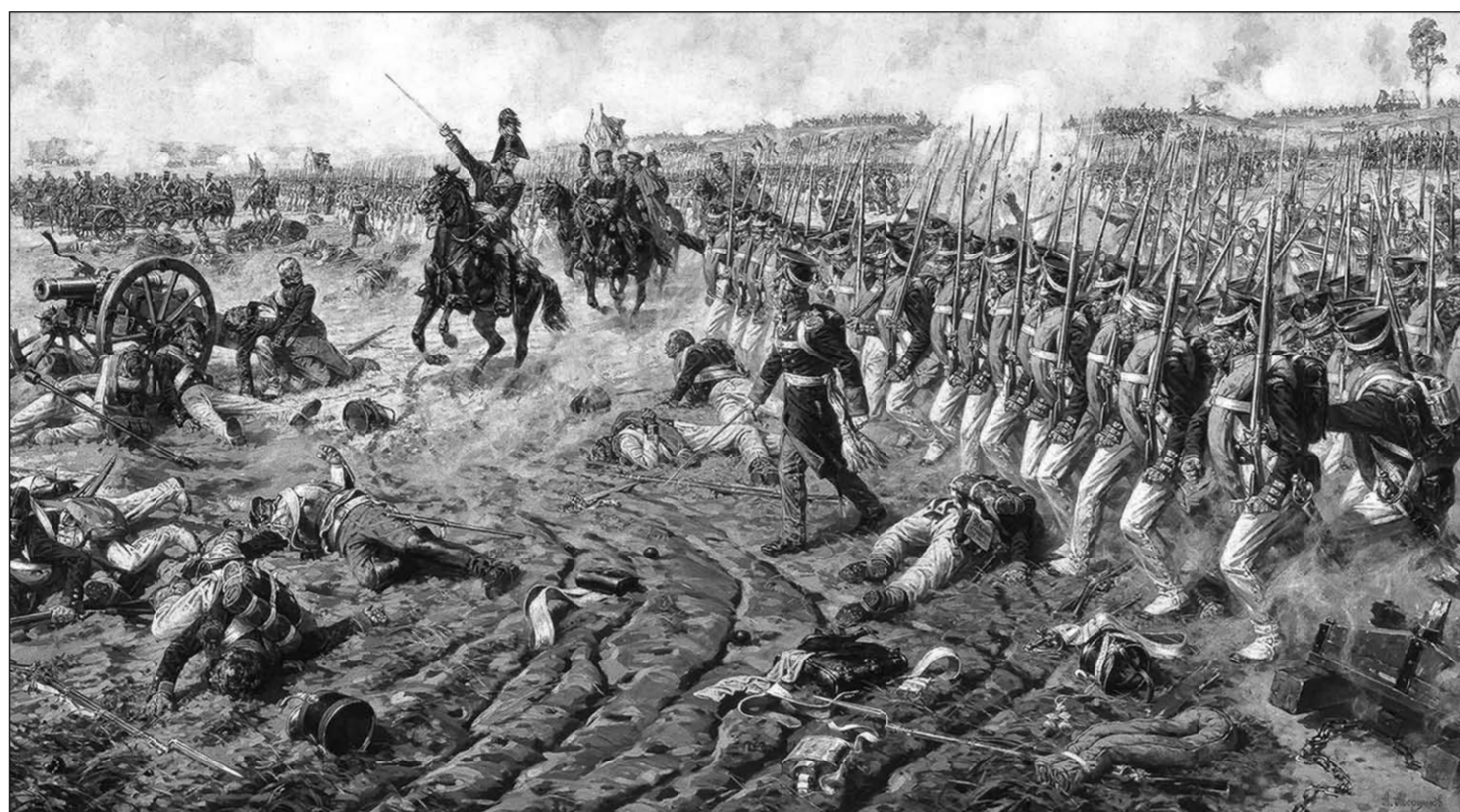
Князь Багратион в Бородинском сражении. Последняя контратака.