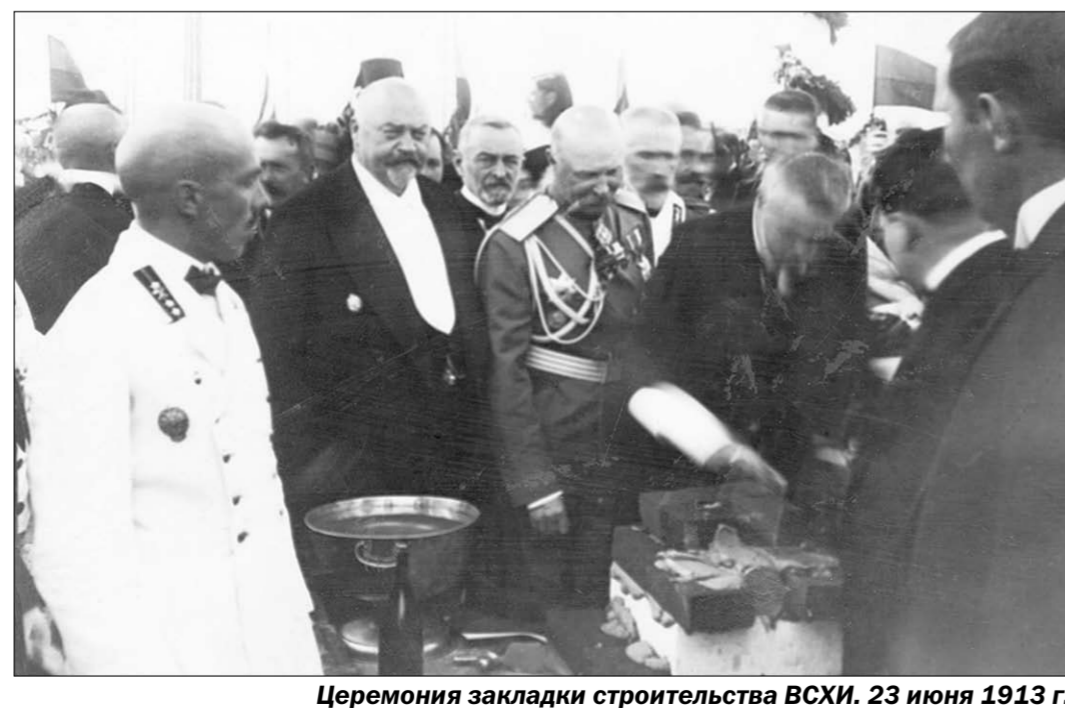
Церемония закладки строительства ВСХИ. 23 июня 1913 г.