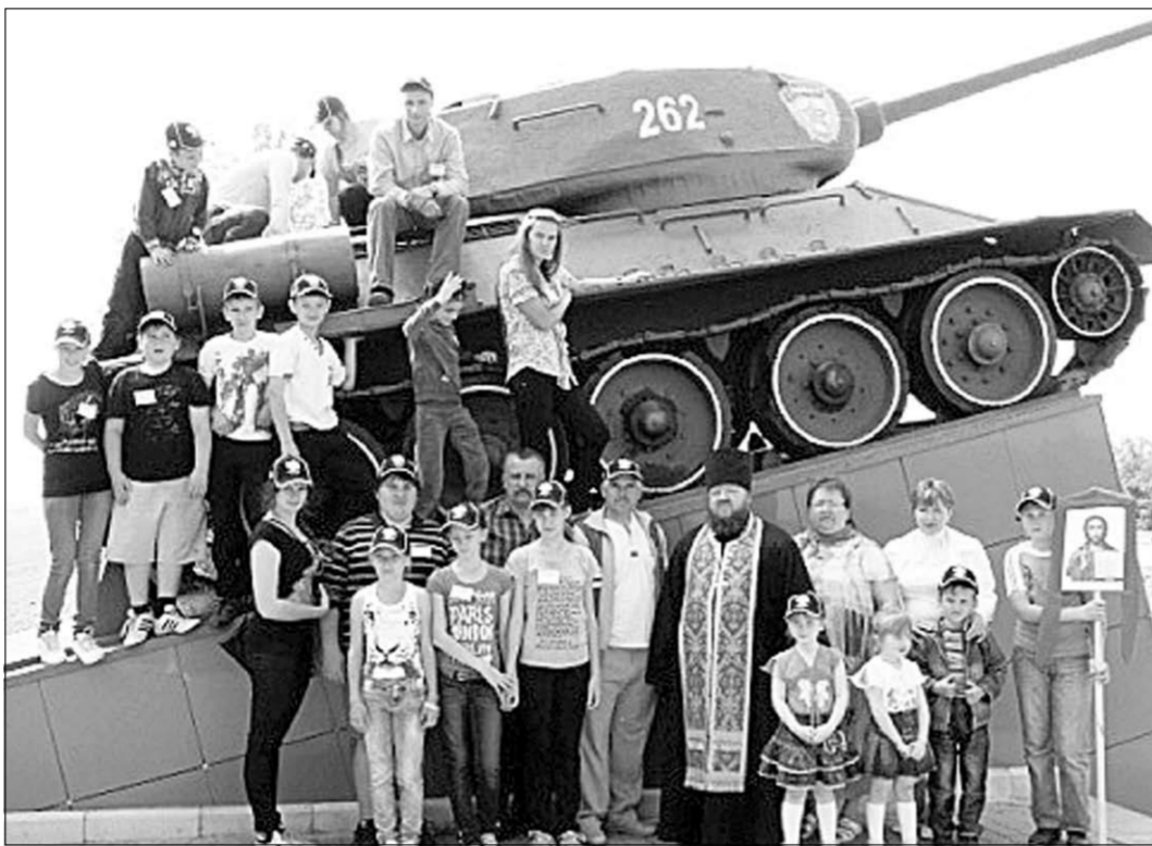
Воспитанники школы Свято-Митрофановского храма.

И далее: «Ближайшая цель операции - разгром 8-й итальянской армии и немецкой оперативной группы «Холлидт». Для этого на Юго-Западном фронте создать две ударные группировки: одну - на правом фланге 1-й