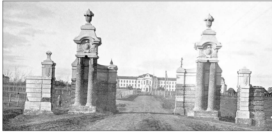
«Красные ворота» Воронежского СХИ. 1929 г.