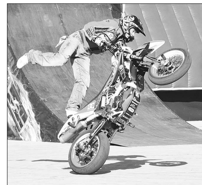
В среду вечером на Адмиралтейскую площадь Воронежа потянулись группы молодых воронежцев, где их взору предстало гастрольное шоу виртуозов на скутерах, мото- и квадроциклах.