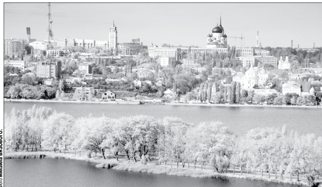
Панорама Воронежа со стороны водохранилища.

Что касается коллег-мэров, то отмечу очень полезную работу в рамках Всероссийского совета местного самоуправления, членом президиума которого я являюсь, Союза российских городов. Во время встреч с коллегами идет живой обмен опытом, вырабатываются оптимальные решения с учетом самого ценно-