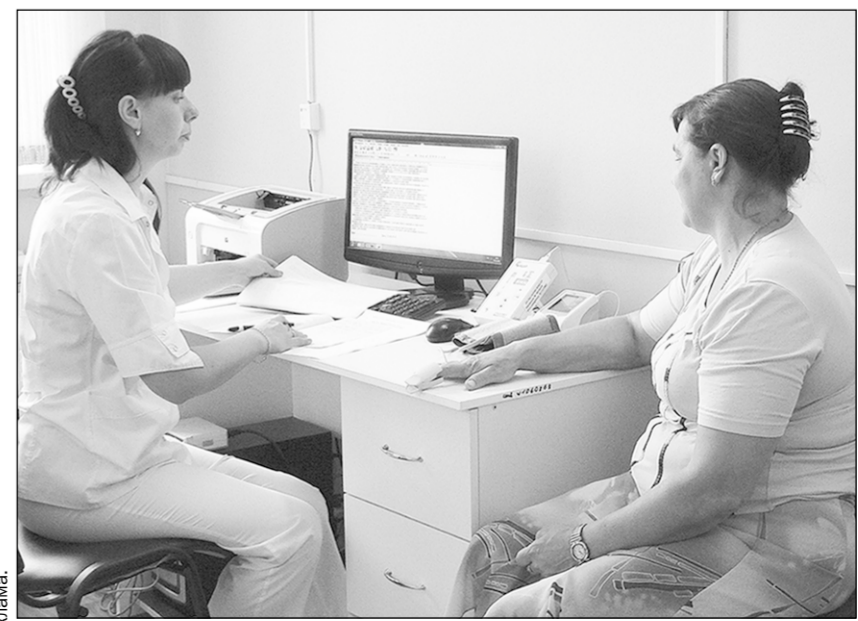
На приёме у специалиста.