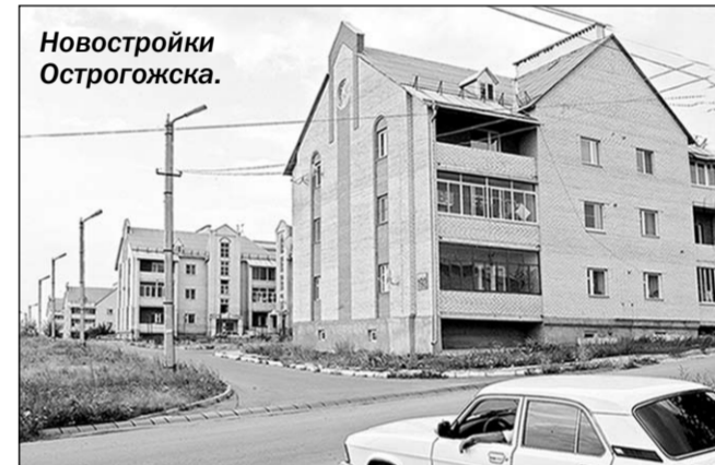
Новостройки Острогожска.

В Острогожском районе обладателями свидетельств на покупку жилья стали четыре семьи. Все они вынужденные переселенцы, которые переехали в здешние места в конце 90-х годов прошлого столетия.