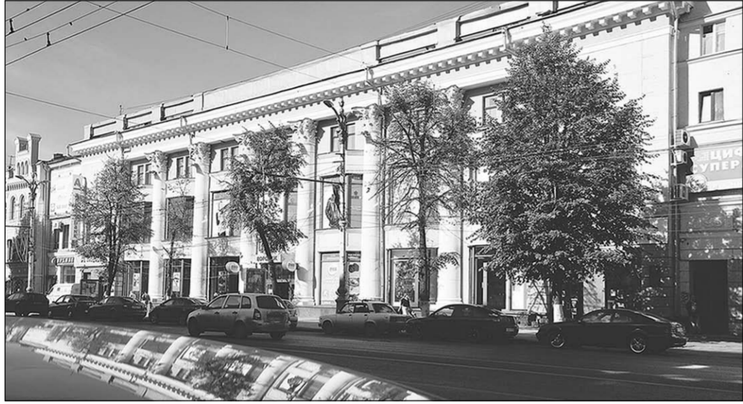
Не окажутся ли исторические здания в тени новоделов?

Из многочисленных сообщений СМИ, которые ссылаются на официальные источники, стало явным, что в самом центре Воронежа будут построены два новых высотных пятизвездочных отеля. Первый – на улице Орджоникидзе, за библиотекой имени И.С.Никитина (ранее против строительства уже активно выступали жители, и проектирование было приостановлено). Второй – 19-этажная отель «Марriott» – на проспекте Революции, за ЦУМом или даже вместо ЦУМа, хотя согласно принятому Воронежской областной думой закону от 21.06.2012 г. он как важный объект дополнительно включен в Программу социально-экономического развития Воронежской области на 2012–2016 годы.