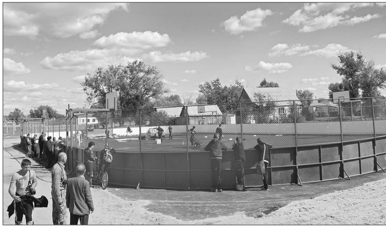
За строительством площадки наблюдают все, от мала до велика.

Там, где мы живём | Школьники из села Старая Меловая с нетерпением ожидают окончания строительства новой всепогодной спортивной площадки