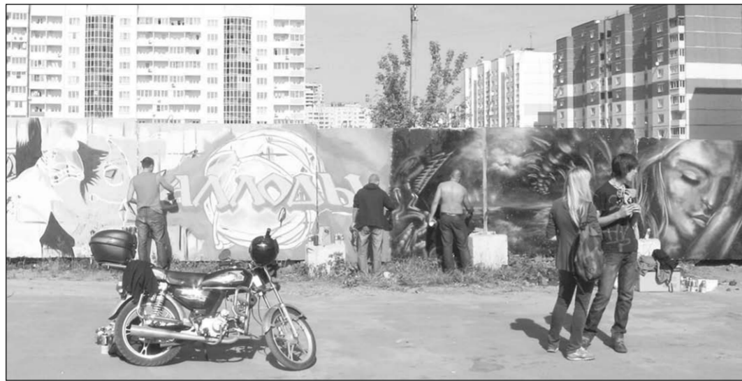
Художники за работой.