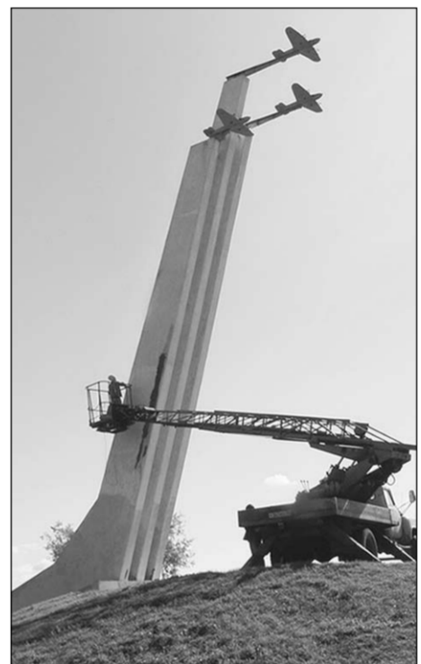
Памятник в парке Второй Воздушной армии «набирает высоту».

- Хороший вопрос: что даёт городу экономика. Наверное, то же, что и любой рачительной хозяйке: дополнительные финансовые средства, которые можно и нужно грамотно потратить. Эффективность хозяйственной деятельности муниципалитета заключается не в том, чтобы потратить на город весь бюджет без остатка. В первую очередь нам - главам - предстоит при минимуме потраченных ресурсов суметь привлечь в город инвесторов, вовремя войти в федеральные программы, предусматривающие хорошие, полноценное финансирование важных социальных проектов. Эффективность главы - это из сорока миллионов рублей муниципальных денег суметь вложить по полтора миллиона в разные программы и привести на территорию города инвесторов. И здесь важно постоянно мониторить ситуацию, вовремя готовить проектную документацию и в сроки делать то, за что поручили. Если всё происходит именно так, то итог радует в первую очередь горожан, а во вторую - представителей всех ветвей власти. Качественно и в указанные сроки выполненная работа - залог того, что данному муниципалитету дадут самый большой кредит. Кредит доверия.