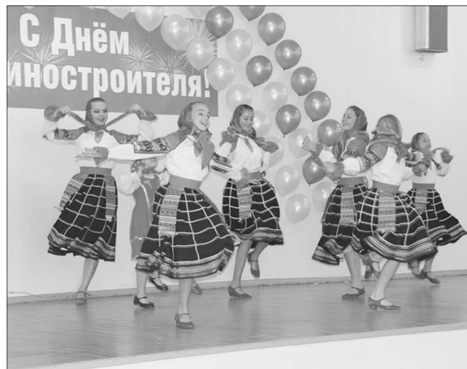
Танцуют «Мы – воронежцы».