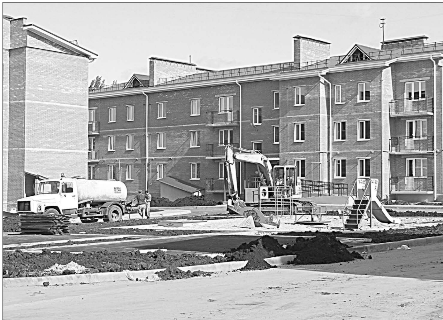
Новый микрорайон на улице Транспортной.