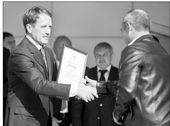
Строителям — благодарность от губернатора.

Власть | В Острогомском прошло выездное заседание правительства Воронежской области