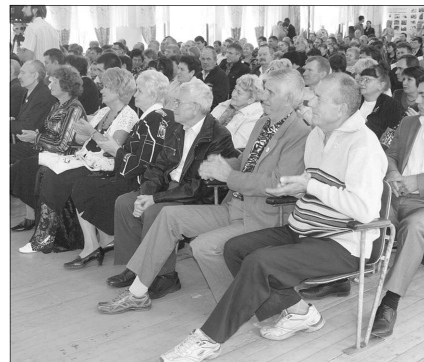
Всё внимание – передовикам.