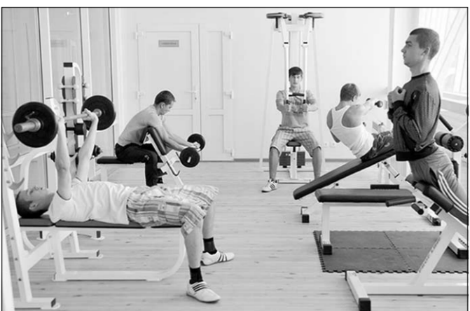
Первые посетители тренажёрного зала.

Приятно, что местная власть занимается проблемами не только района, но и районного центра. Острогожск — один из старейших городов Воронежской области, к тому же в этом году отметил юбилей — 360 лет со дня основания. Отрадно отметить, что город благоустривается, идёт развитие социальной инфраструктуры, приводятся в порядок здания и улицы, — заключил Алексей Гордеев.