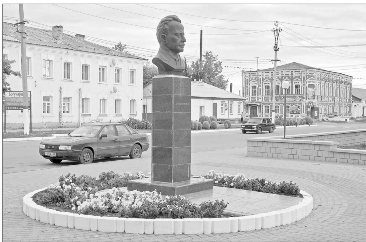
В центре города — памятник писателю Михаилу Шолохову.

Да, потому что искренне радуюсь этому. Сколько лет богучарцы мечтали о том, чтобы летом можно было выкупаться, не выезжая далеко за город. Мы затронули массу усилий, чтобы добиться работы земснаряда в Богучаре. Очистка реки в центре города является одним из главных достижений администрации и депутатов Богучара, так как это дало возможность развивать благоустройство этой части города. Конечно, обследовать дно, завести песок, установить оборудование — особой сложности не представляет, а вот возродит заново реку, на месте которой рос камыш и протекал небольшой ручей, то есть самой реки практически не было, вот это действительно сложно. В прошлом году мы получили официальное заключение о том, что на набережной — не дикое место для купания, а настоящий городской пляж. На нем есть и спасатели, и дежурные. Нам приятно, что сюда приезжают купаться даже из соседних районов.