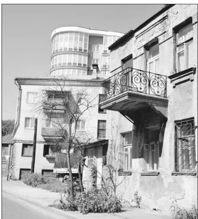
Этому дому более ста лет. Он и ещё столько же простит. Его надо только отреставрировать.