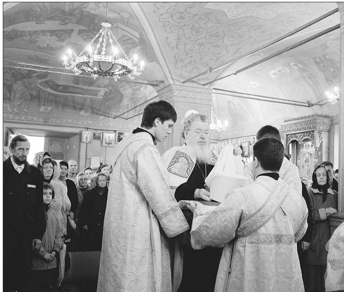
В праздничный день в Покровском соборе было многолюдно и торжественно.

В этот праздничный день в соборе было многолюдно и торжественно. Все — от мала до велика — внимали каждому слову Владыки Сергея, который обратился к присутствующим после завершения богослужения: «Нынешний день знаменателен не только для Покровского собора, но и для всех воронежцев. Этот храм имеет древнюю историю, такую же тревожную, как и история самого города. Ему выпала печальная судьба быть центром антирелигиозной жизни, — именно здесь располагался музей антирелигиозной пропаганды. Но в этом храме начиналось и возрождение духовной жизни воронежского края после Великой Отечественной войны. В 1948 году по ходатайству Владыки Иосифа