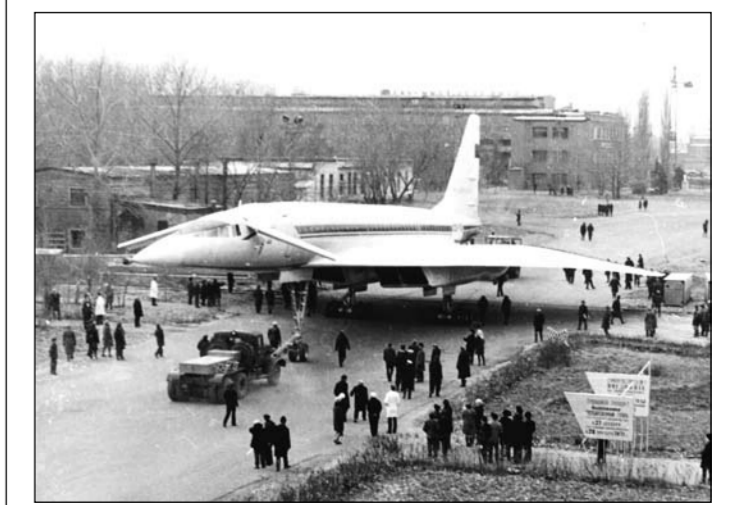
Перекатка Ту-144 на взлётную полосу аэродрома.