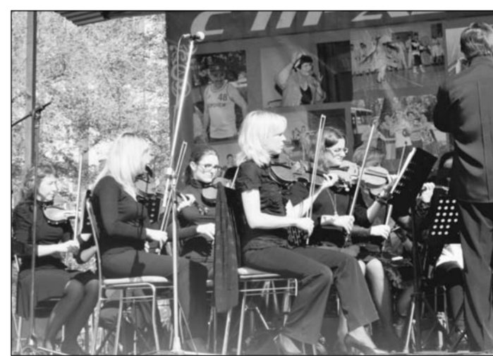
Выступает молодёжный симфонический оркестр.

...Красно-кирпичные дома начала прошлого века близко стоят друг от друга, как ветераны-воины на страже нашего обихода достояния. Так помогите им выжить в пору нынешнего строительного беспредела, исторического беспамьяства, профессионального невежества и привычного чиновничьего равнодушия. Потому что за это нам скажут только огромное спасибо!