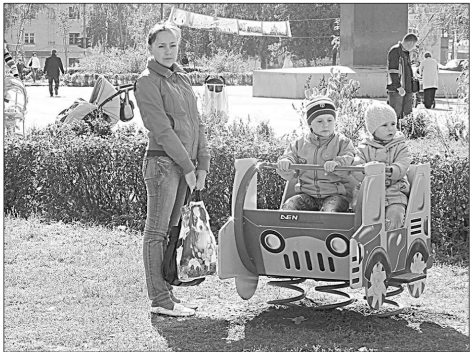
На детской площадке - будущее Семилук.

- Безусловно, держим. Отмечаем, что завод постепенно, но уверенно набирает силы. Там уже нет сокращений. Предприятие хорошо работает. За последние месяцы Семилукский огнеупорный завод вышел на такой уровень стабильности, когда работающие на нём люди наконец перестали переживать за будущее градообразующего предприятия. В планах у завода - строительство теплоэлектростанции. Сейчас этот вопрос находится на стадии начала проектирования. Скорее всего, строительство объекта начнётся в следующем году.