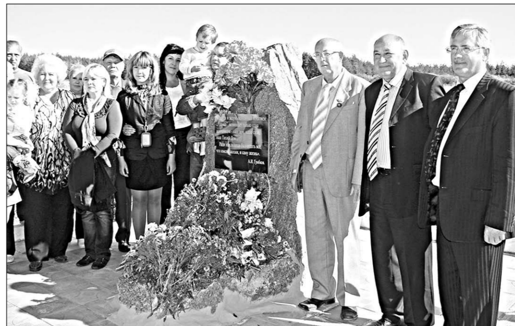
На торжественном открытии памятника.