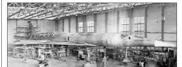
Ту-144 в сборочном цехе Воронежского авиазавода.