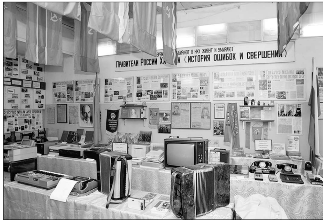
Ещё совсем недавно эти вещи были частью нашей жизни.

Большое место в экспозиции занимает раздел, посвященный Великой Отечественной войне. В результате поисковой работы школьного отряда появились немало интересных экспонатов, найденных в окрестностях Воронежца: каски, снаряды, пули. На уроках истории, которые проходят в музее, ребята с интересом изучают письма с фронта, воспоминания участников войны, пожелтевшие газетные страницы. Учителя заметили, что