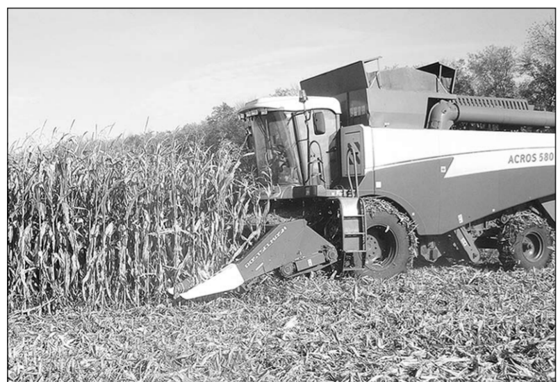
Идёт уборка кукурузы.